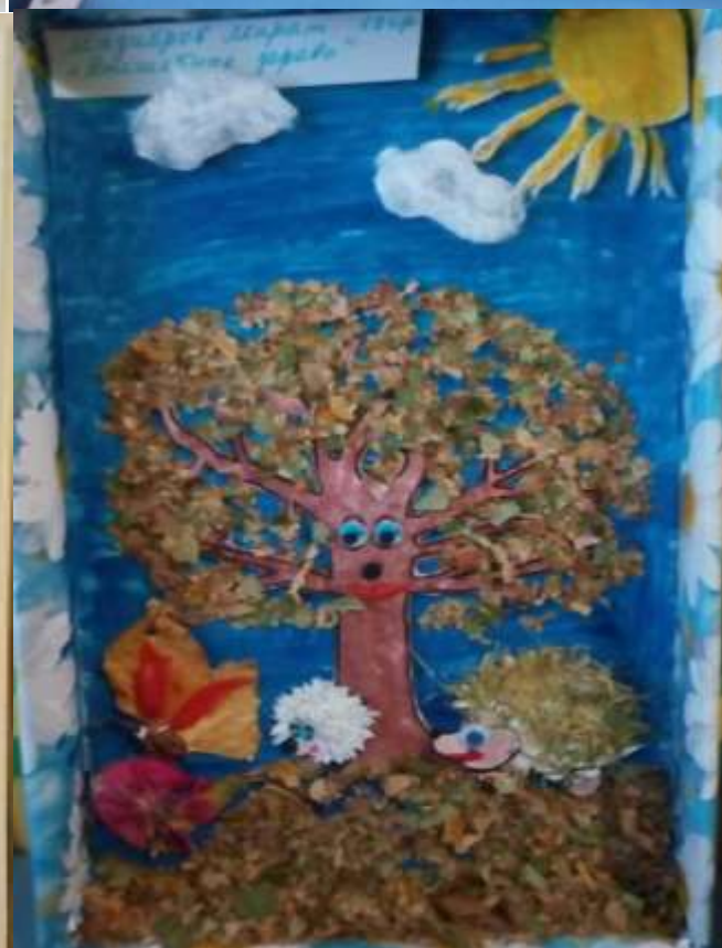
Поделки на конкурс «Дары Осени».