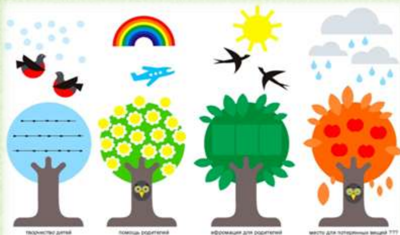
Декор раздевалки в детском саду на тему «Времена года»