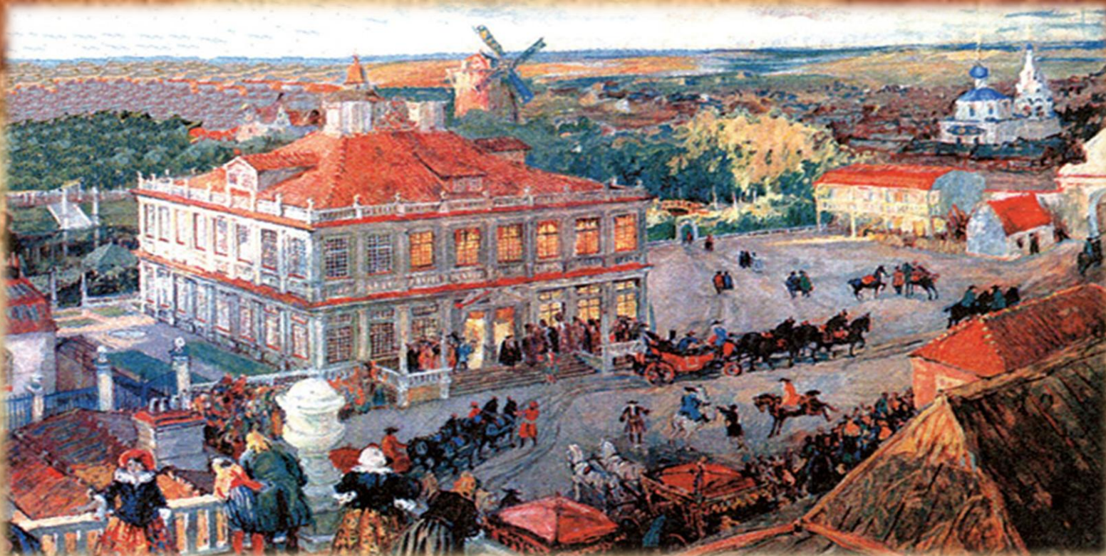
Немецкая слобода под Москвой. Художник А.Н.Бенуа

С воцарением династии Романовых началось систематическое приглашение для консультаций и на службу в Россию иностранных военных специалистов, врачей, аптекарей. На окраине Москвы появилась Немецкая слобода - Кукуй, где жили выходцы из западноевропейских стран.