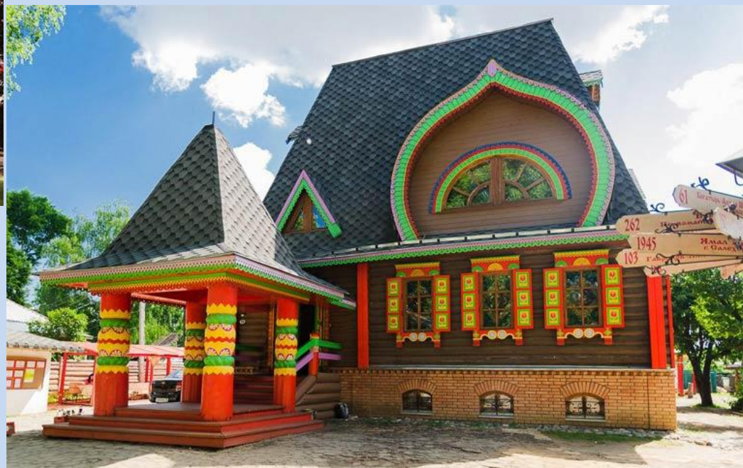
«Дом Берендея» в Переславле-Залесском