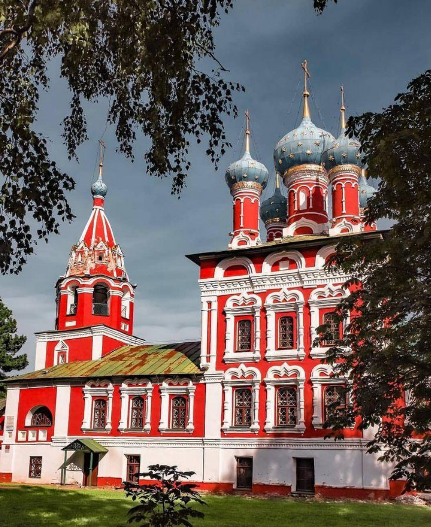
Церковь царевича Дмитрия на крови