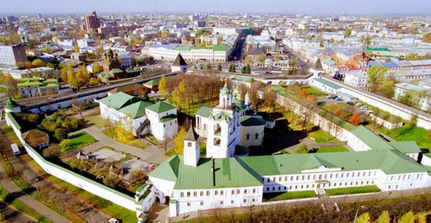
Спасо-Преображенский монастырь в Ярославле