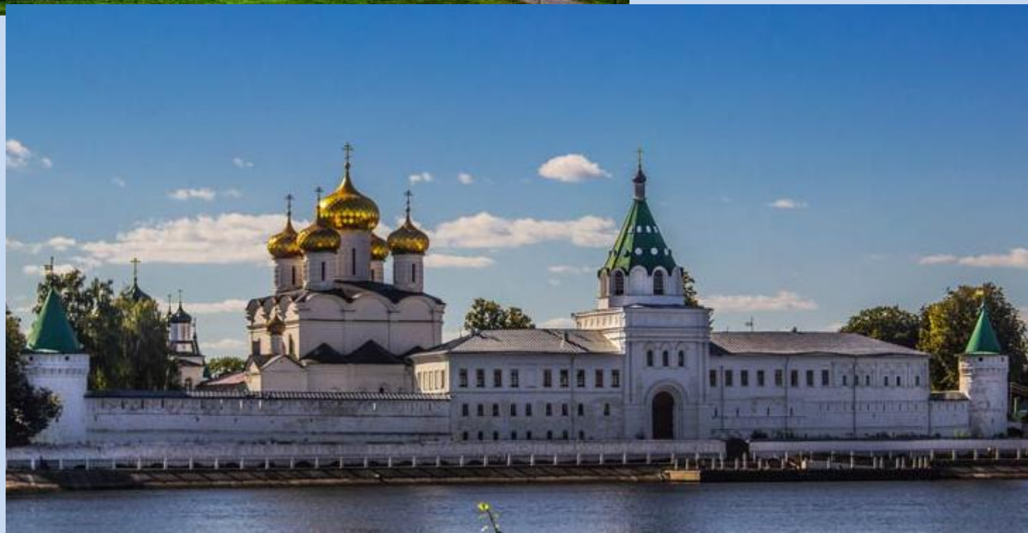
Ипатьевский Монастырь в Костроме