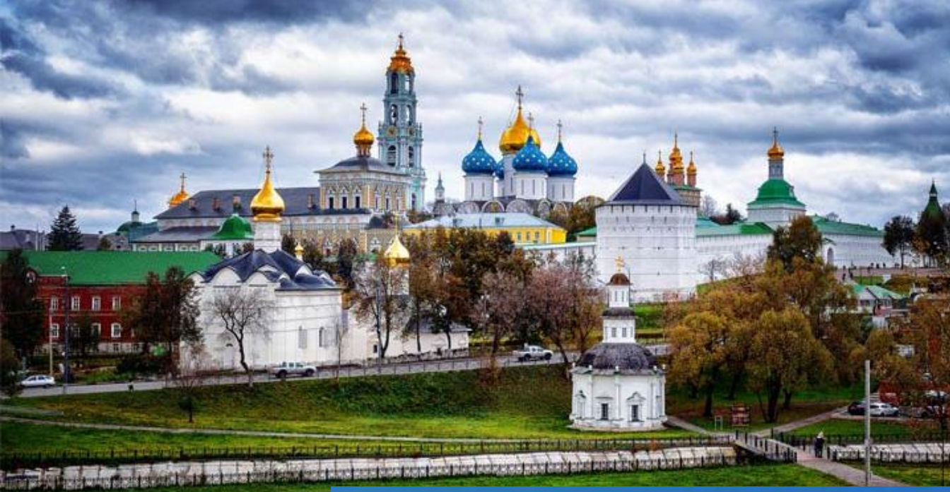
Троице- Сергиева лавра