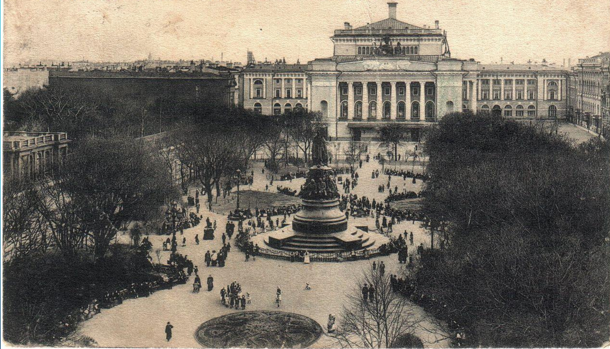
С.-ПЕТЕРБУРГЪ, Александринскій театръ и Памятникъ Императрицѣ Екатеринѣ II. ST-PETERSBOURG. Théâtre d'Alexandra. Monument de l'Imperatrice Cathérine II.