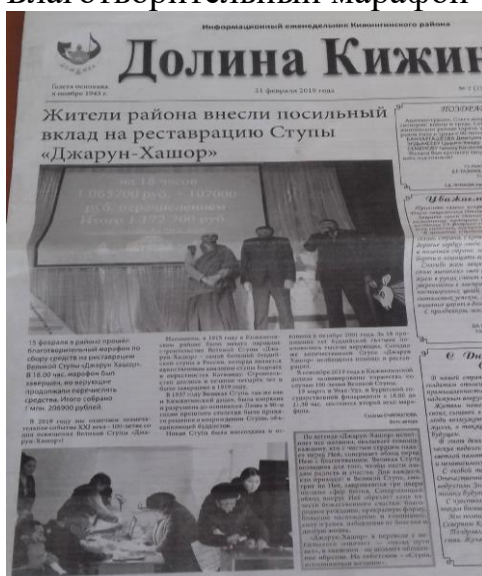
Благотворительный марафон 19.03.2019г.