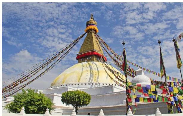
Ступа Боднатх близ Катманду