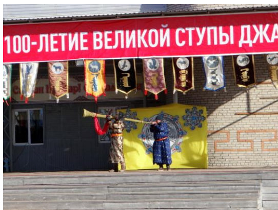
Благотворительный марафон 15.02.2019г.