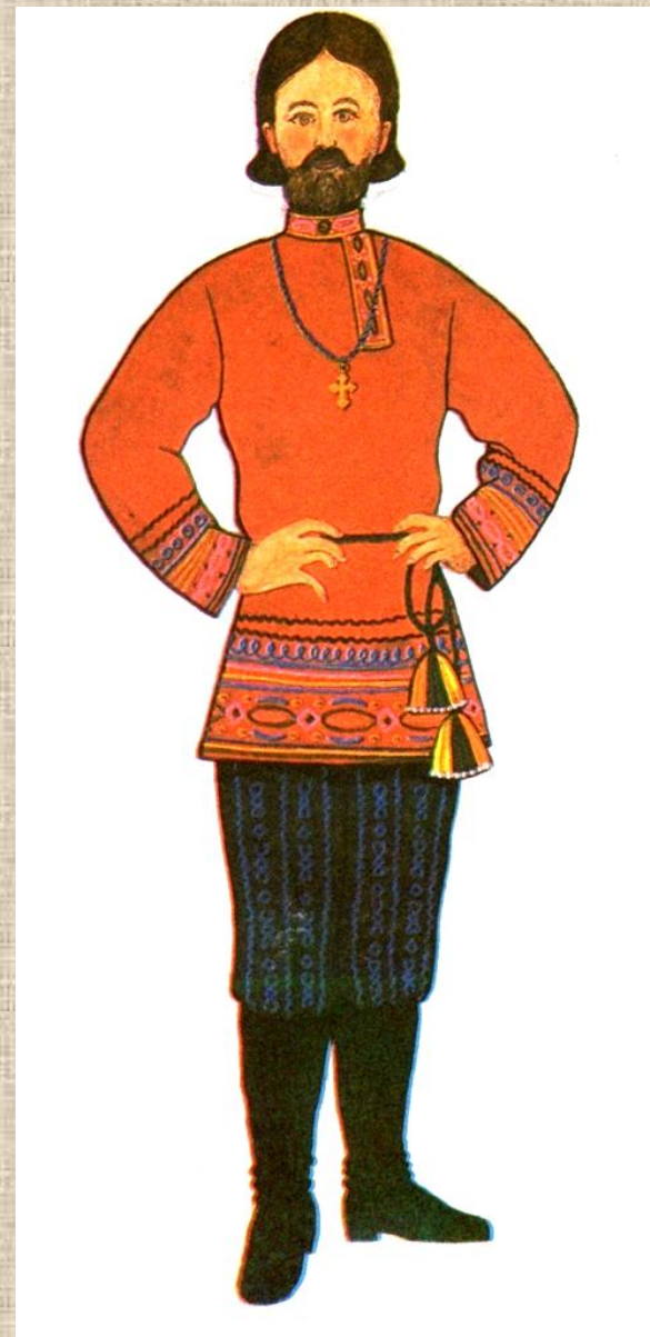
Мужская одежда на кануне сватовства