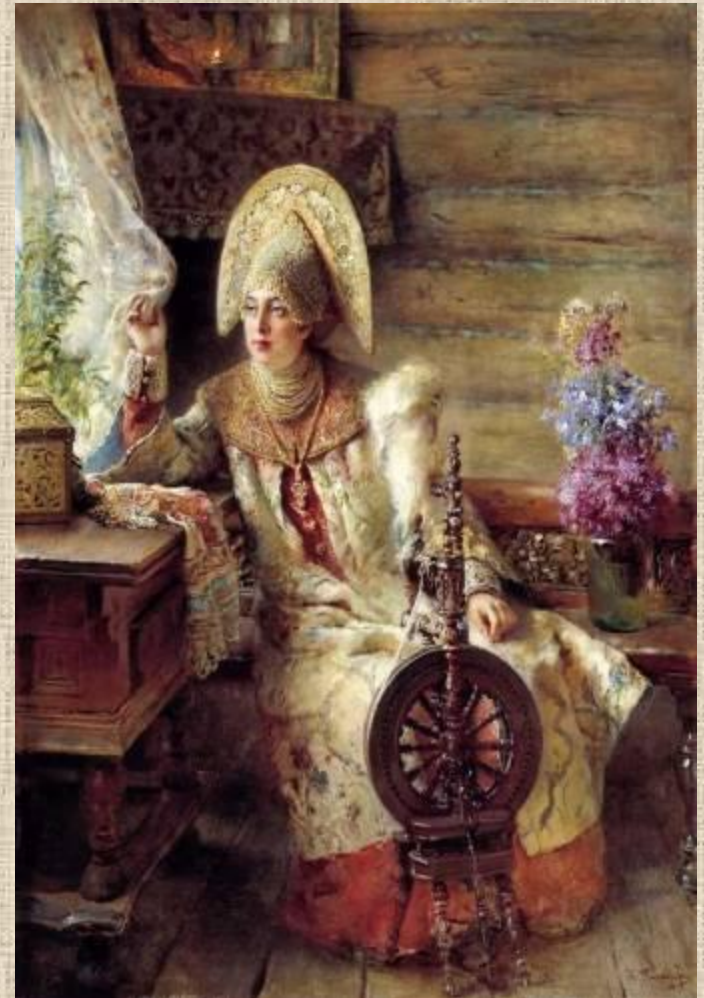
К. Е. Маковский «Боярышня у окна»