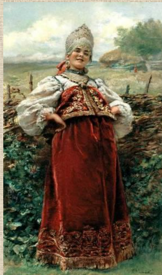
К. Е. Маковский «У околицы»