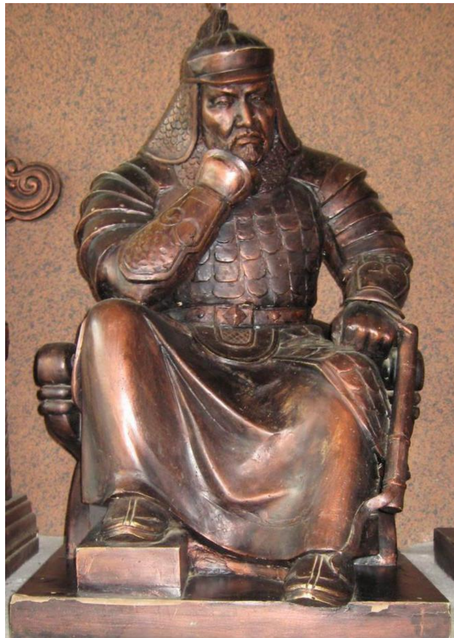
Статуя Батые в Монголии