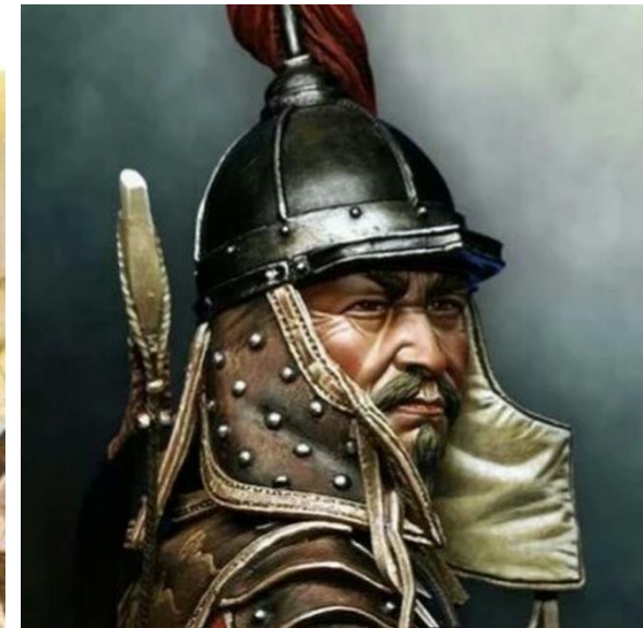
Битва под Легницей