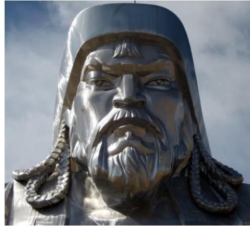
Памятник Батыю в Монголии

После взятия Козельска обессиленные отряды Батые ушли в богатые пастбищами придонские степи и провели там всё лето 1238 года. А осенью они совершили набеги на Муром, Нижний Новгород и другие города Северо – Восточной Руси.