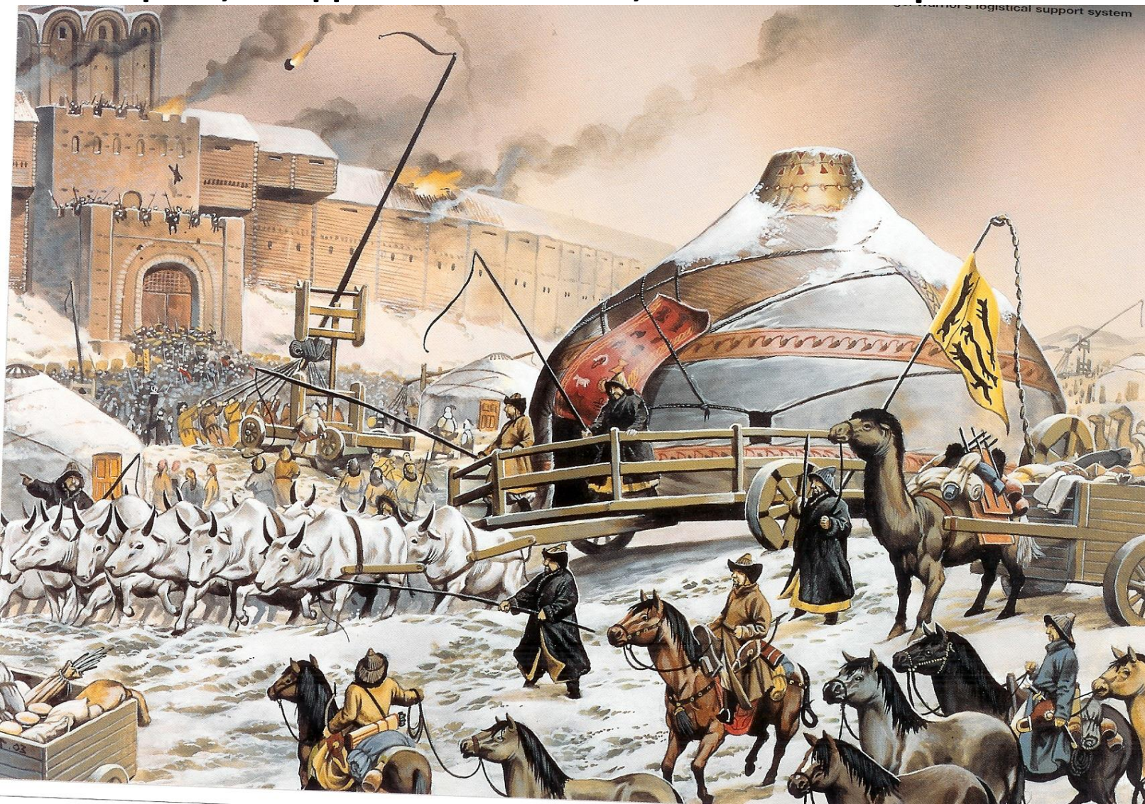
Трёхмесяч- ная осада Киева, 1240 год

В начале 1239 г. Последовал удар по землям Юго – Восточной Руси. В октябре был захвачен Чернигов. Осенью 1240 г. пали Киев, Галич и множество других городов. Князь Даниил Галицкий, владевший Киевом, бежал в Венгрию.