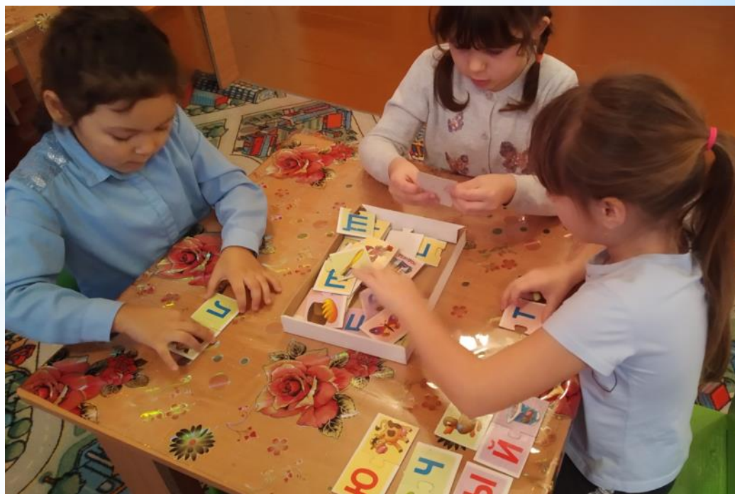
Дидактическая игра «Азбука»