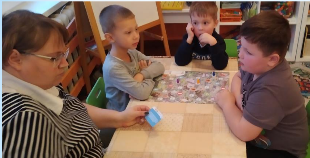
Дидактическая игра «ПДД»