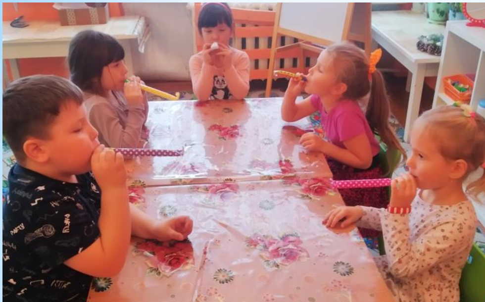
Игра на речевое дыхание «Прожорливые фрукты»