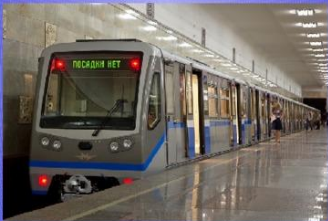
Схема метро похожа немножко на разноцветную «многоножку». Только, по правде, каждая «ножка» - Для электрички рельсо - дорожка.