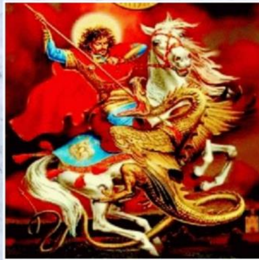
Святой Георгий Победоносец

Жители города, пораженные чудом стали прославлять Святого Георгия, пересказывать его подвиг и изображать его лик»