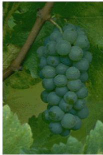
Пояснительная подпись под рисунком.

Эта статья может состоять не более чем из 125-175 слов.