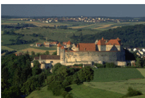
Пояснительная подпись под рисунком.

Эта статья может состоять не более чем из 50-100 слов.