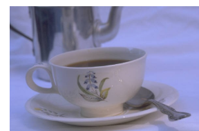
Пояснительная подпись под рисунком.

Выбранное изображение поместите рядом с текстом. Подпись под изображением поместите рядом с изображением.