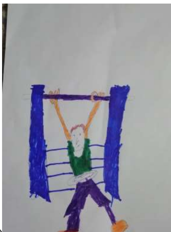
«Тренируюсь днем и ночью»