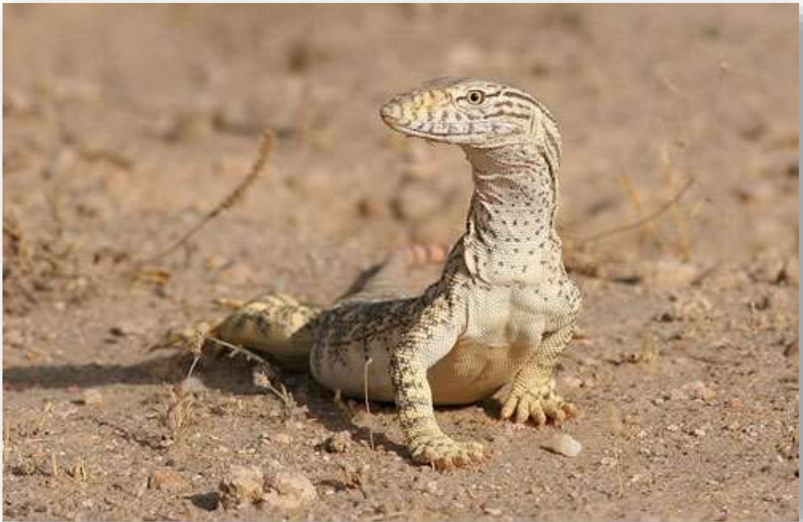
Хищная ящерица – варан.