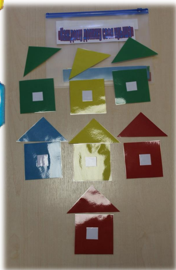
Дидактическая игра «Каждому домику своя крыша»