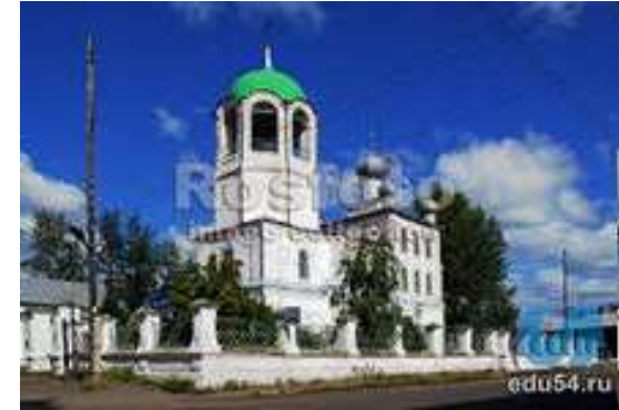
Енисейск –отец городов сибирских