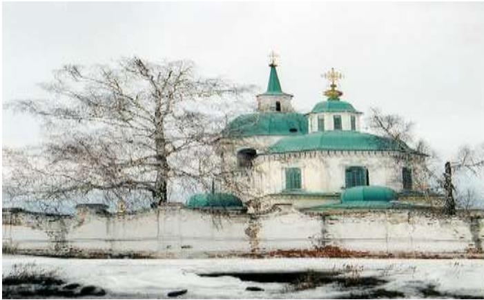
Спасо-Преображенский монастырь. 1642 г.г.Енисейск

Енисейск(основан в 1619г)- город-музей под открытым небом. Один из старинных городов края. Основная хозяйственная деятельность — добыча пушнины, рыбной промысел, добыча золота. В 1645—1646 гг. товарооборот енисейского рынка превышал 60 тысяч рублей. Занесен в список Всемирного наследия Юнеско