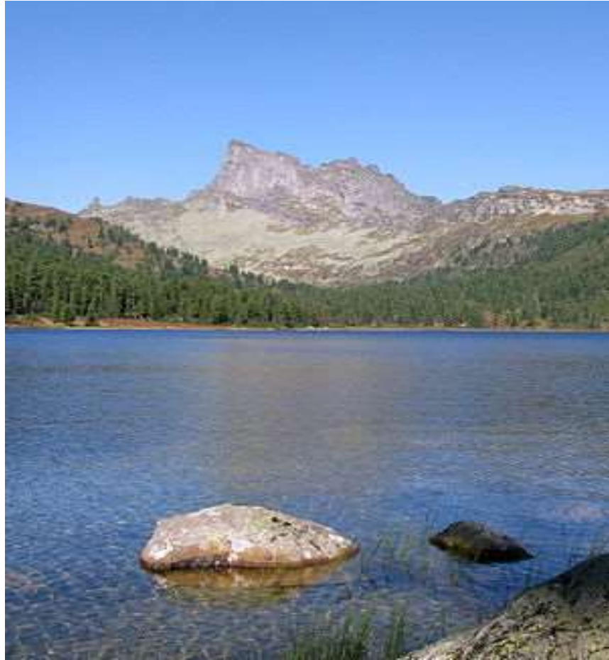
Пик Звёздный (2265 м). Ергаки, Западный Саян

Ергáки (Иргаки) — уникальный природный парк, туристический центр хребта Ергак-Таргак-Тайга в Западном Саяне. Расположен в истоках рек Большой Кебеж, Большой Ключ, Тайгиш, Верхняя Буйба, Средняя Буйба и Нижняя Буйба.