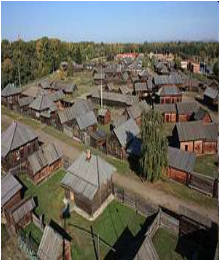
Вид на улицу

Историко-этнографический музей-заповедник «Шушенское» (прежде «Сибирская ссылка В.И. Ленина»)(основан в 1930г.) – уникальный комплекс под открытым небом.