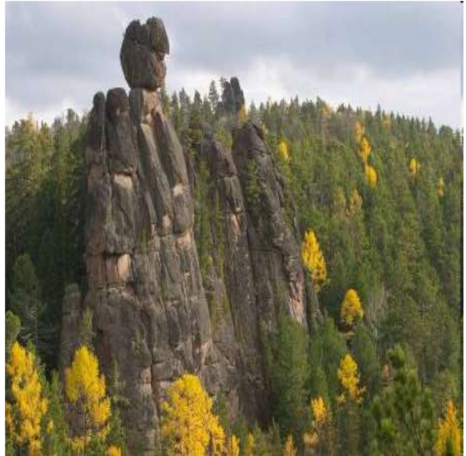
Скала Манская баба