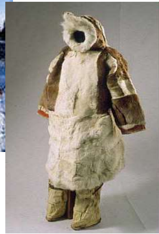
Быт и национальная одежда нганасанов