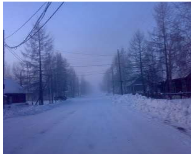
Зима в Туруханске Морозы достигают -57