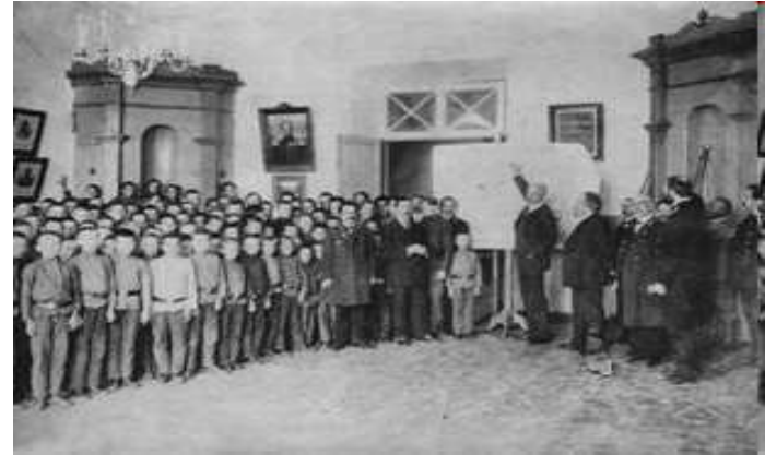
Исследователь Ф.Нансен в мужской гимназии г.Енисейск 1913.г