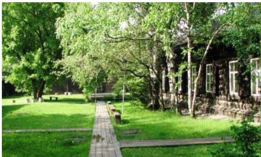
Вид на улицу

Музей-усадьба В.И.Сурикова(г.Красноярск)(основан в 1930 г.) бережно хранит традиции казачьего быта и уникальную коллекцию произведений российского живописца.