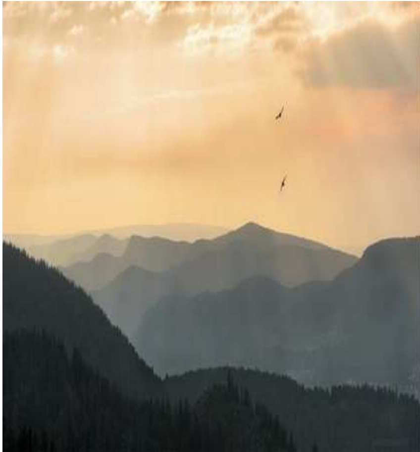
Вид с горы Такмак (заповедник Столбы)

Альпинизм в Красноярском крае культивируется с 1949 г., когда была образована секция альпинизма, туризма и скалолазания. Скалолазание на Столбах – любимый досуг молодежи.