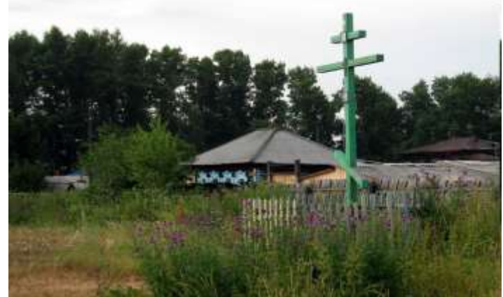
Могила сосланного декабриста А.И.Якубовича 1845г.г.Енисейск