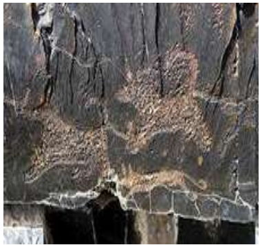
Наскальная живопись горы Каратаг