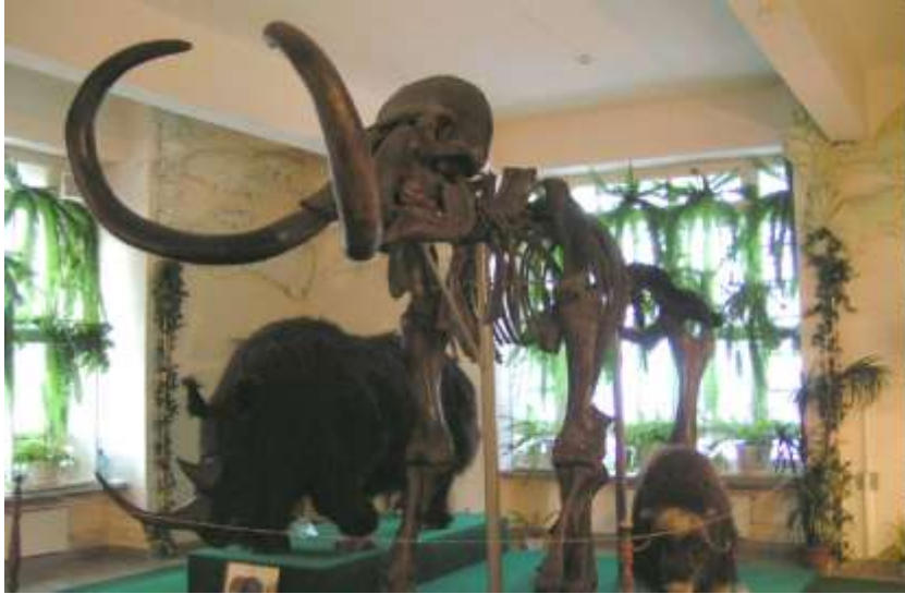
Экспонат краеведческого музея

Красноярский краевой краеведческий музей входит в ряд первых музеев Сибири и Дальнего Востока( создан в 1889 г).На сегодняшний день является образовательным и информационным центром всего Красноярского края. Является членом Союза музеев России с 2002 года.