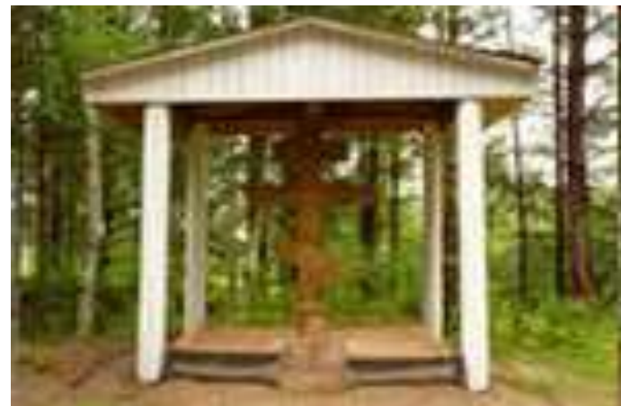
Церковь на Монастырском озере