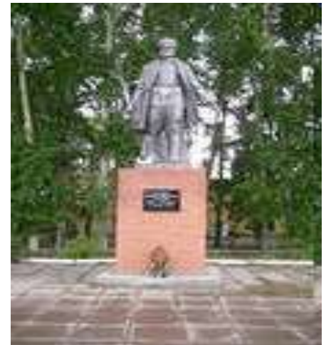
Памятник героям гражданской войны. г.Лесосибирск