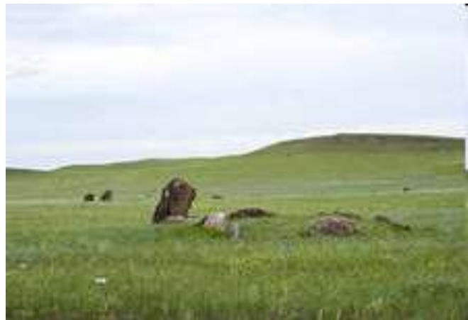
Место раскопок (Шарыповский район)

Стать участниками археологической экспедиции смогут не только российские, но и иностранные студенты – из СНГ, Западной Европы, США и Латинской Америки. Первые экспедиции уже обнаружили артефакты раннескифского времени. В их число входят железные ножи и топоры, бронзовые подвески и элементы украшения одежды, керамика различных эпох. Уникальными находками стали колчанный крюк в виде грифона и портупейная пряжка. Орнамент на пряжке напоминает изображение китайской маски Тао-те, что говорит о китайском влиянии на культуру скифов.