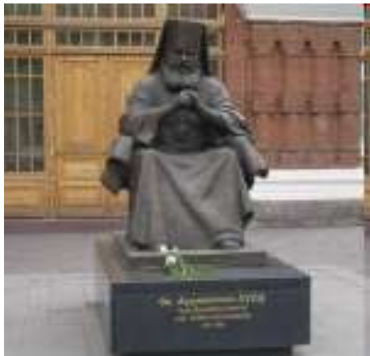
Памятник архиепископу Луке Войно-Ясенецкому г.Красноярск