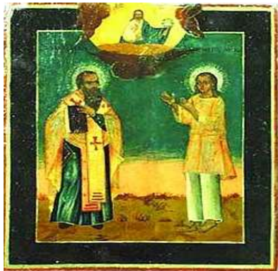
Икона Василия Мангазейского ,сибирский первомученик, святой Русской православной церкви, похоронен в монастыре села.