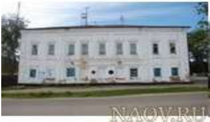
Дом купца Грязнова (конец 18 века)г.Енисейск