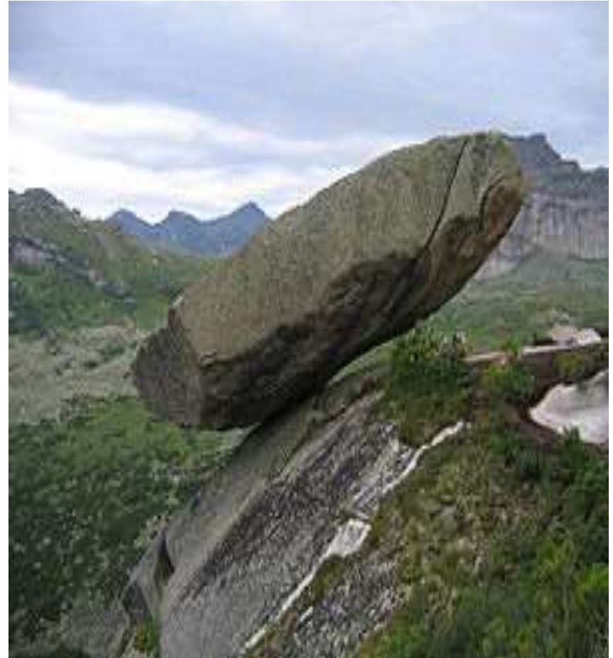
Висячий камень в западной части парка