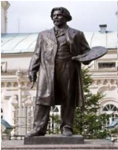
Памятник Сурикову В.И г.Красноярск

• краеведческих музеев и памятников (Мемориальный дом-музей В.П.Астафьева, Дом –усадьба Сурикова) (Красноярск, Лесосибирск, Енисейск, Норильск )