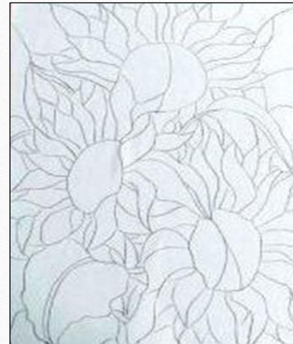
Фото 2. Образец рисунка