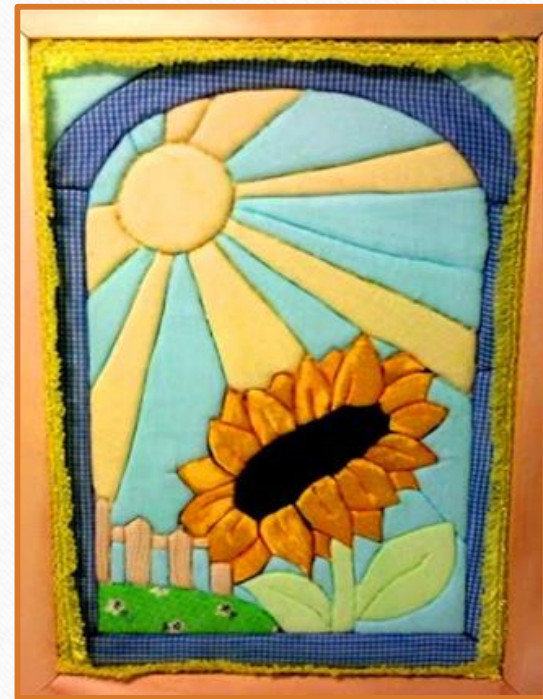
Фото№9 Учебная работа