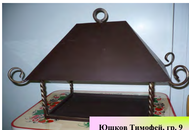
Юшков Тимофей, гр. 9