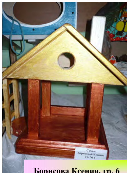
Борисова Ксения, гр. 6