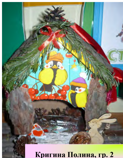
Кригина Полина, гр. 2

муниципальное казенное дошкольное образовательное учреждение города Новосибирска "Детский сад № 33 комбинированного вида"