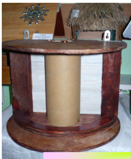
Гулина Даша, гр. 12