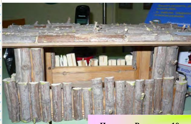
Пинягин Рома, гр. 10

адрес электронной почты: ds_33_nsk@nios.ru