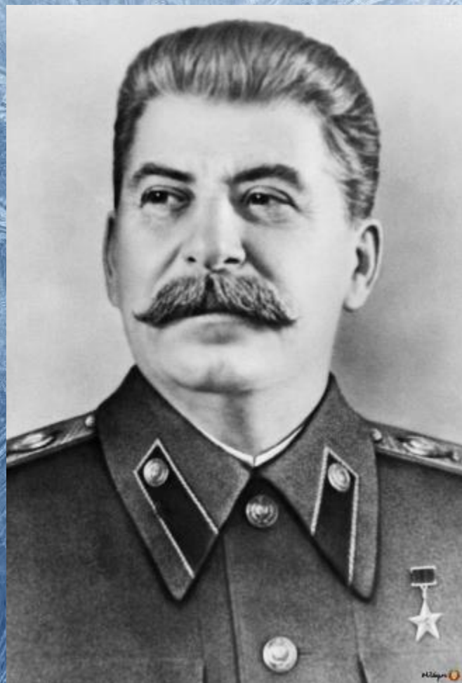
Иосиф Виссарионович Сталин (1878-1953)