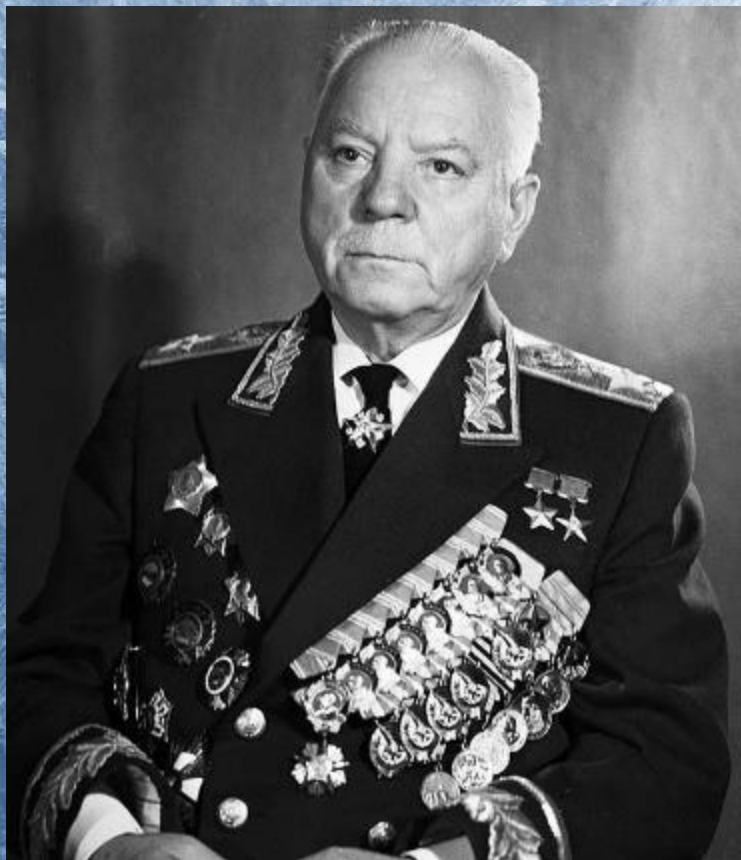
Климент Ефремович Ворошилов (1881-1969)