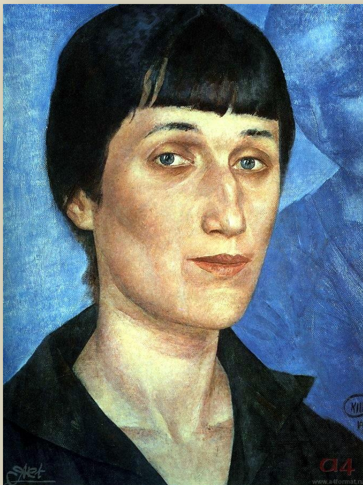
А.А. Ахматова. К. Петров-Водкин. 1922