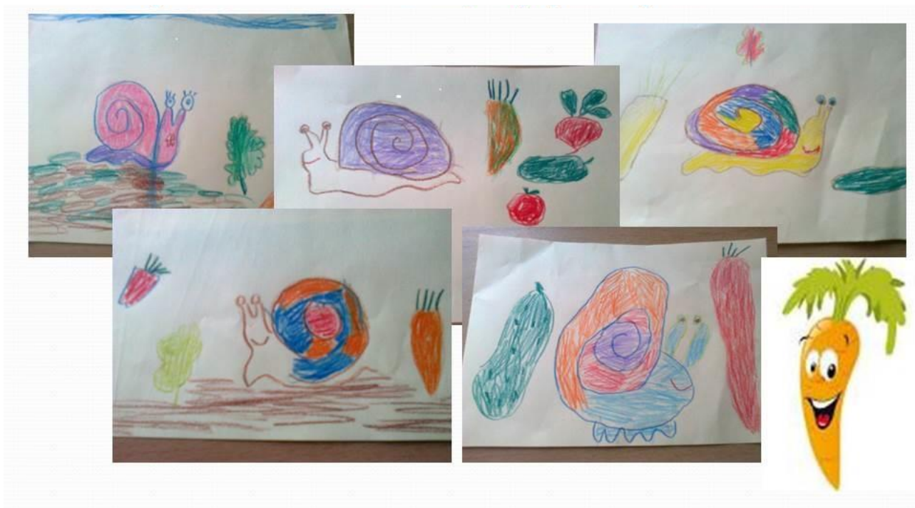
Выставка детских рисунков «Овощи для улитки»