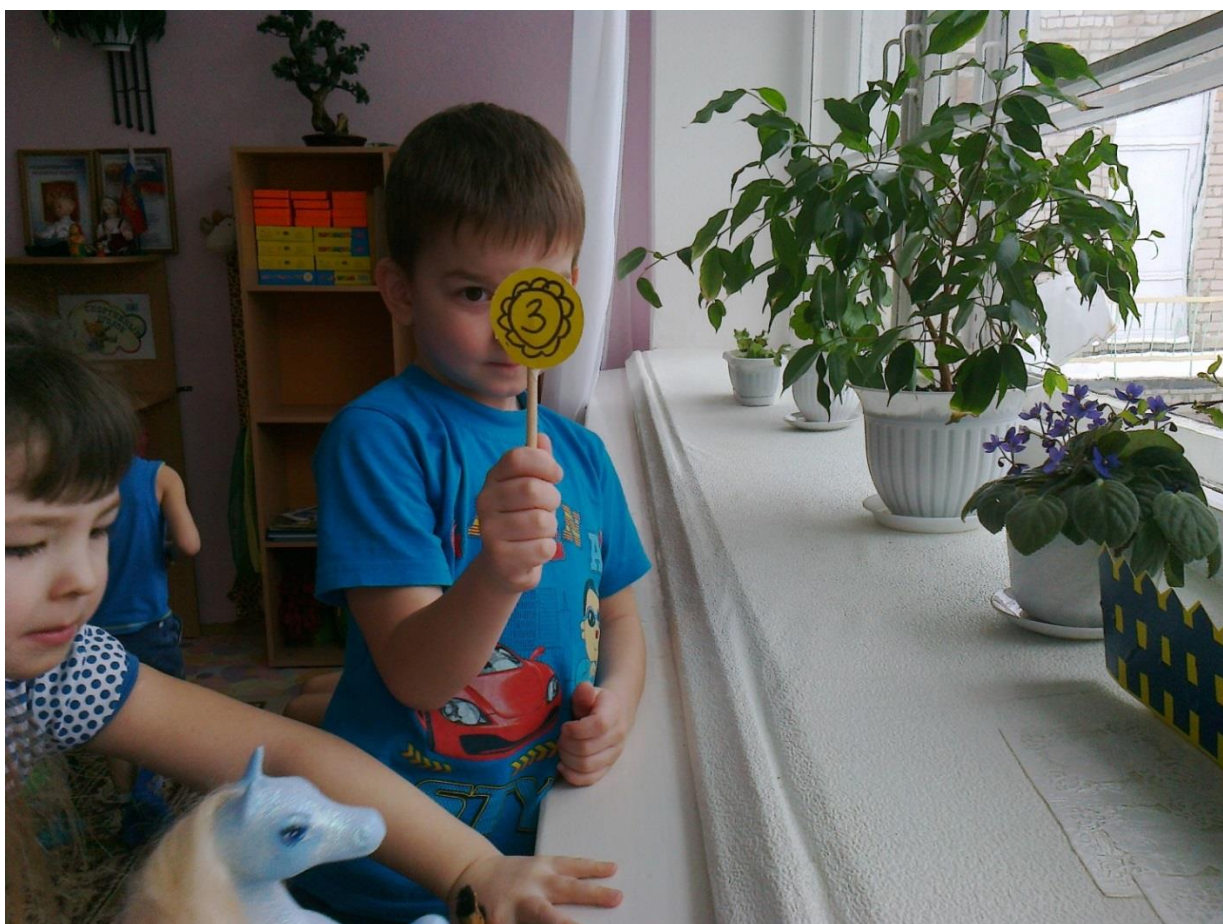
Соревнование среди овощей «Что первое взойдёт».