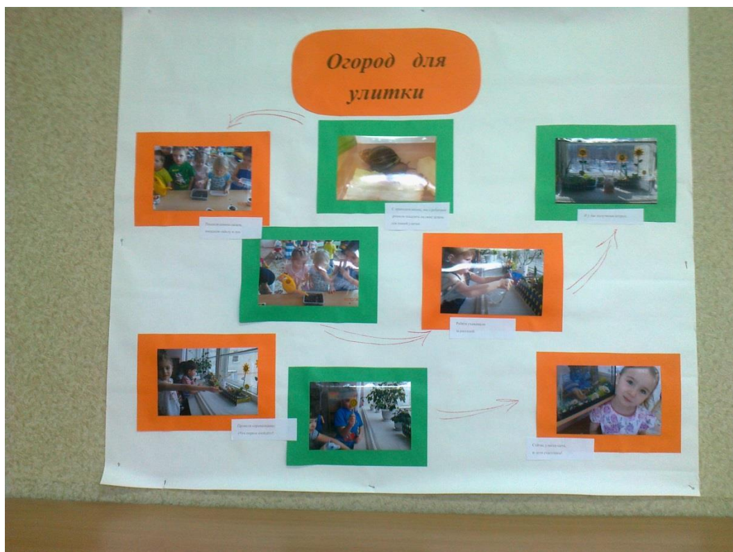
Фоторепортаж для родителей «Огород для улитки».