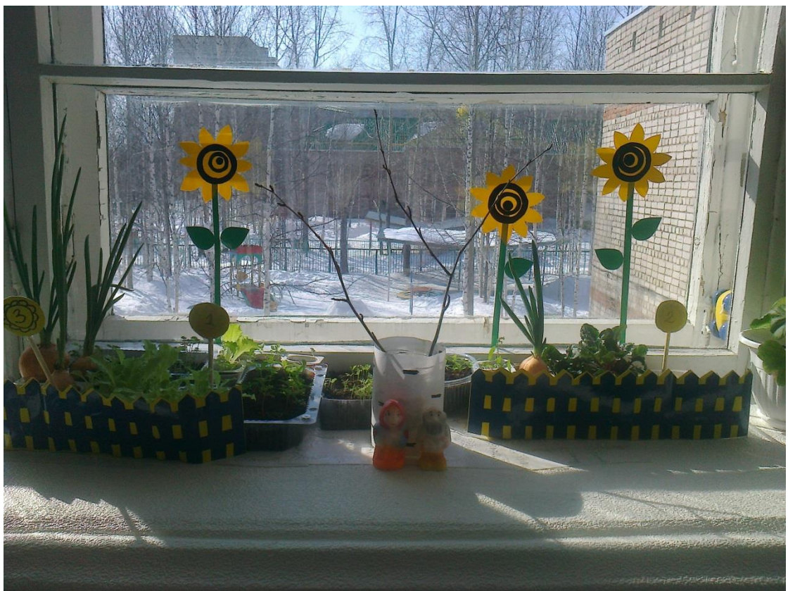
Оформление огорода на окне