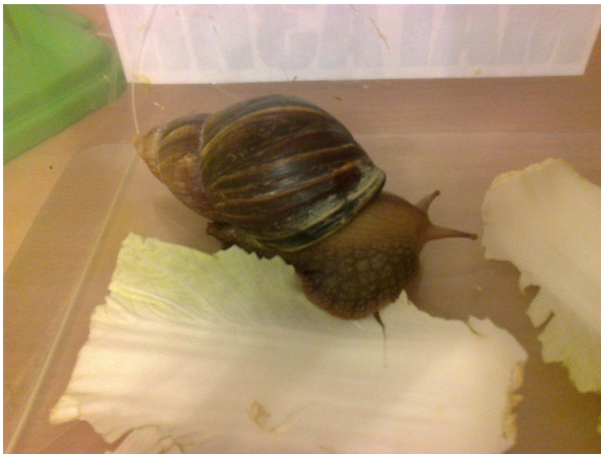
Африканской улитке Ахати́на гигáнтская

таблички за первое, второе и третье места. А когда рассада подрастёт, кормят зелёными листьями улитку, живущую в группе.