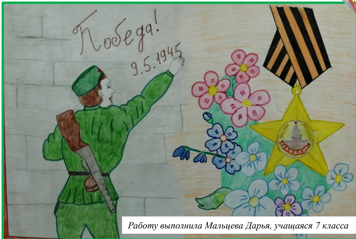
Работу выполнила Мальцева Дарья, учащаяся 7 класса