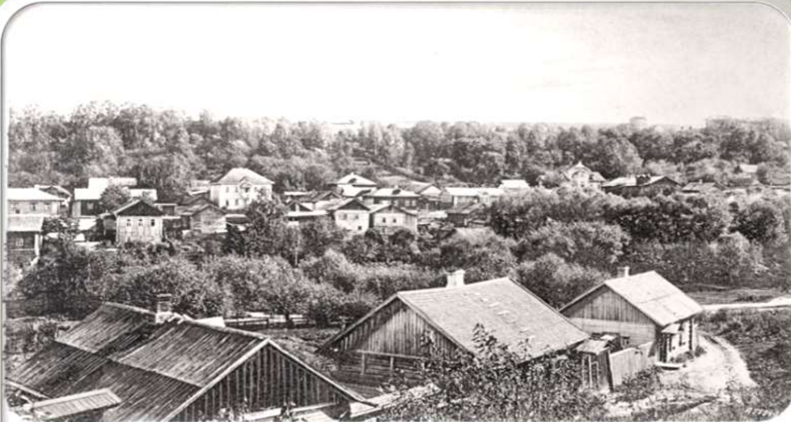
Видъ съ Козинки.