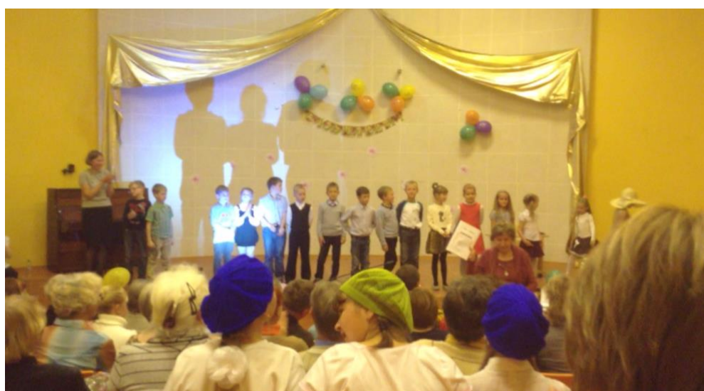
Мы в районной детской библиотеке. Книга подарена