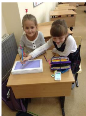
Оформляем книгу: последние "точечки" на обложке