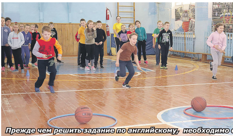
Прежде чем решить задание по английскому, необходимо отличиться в «весёлых стартах»