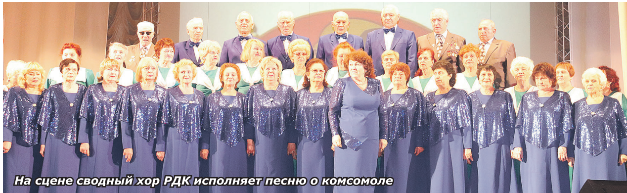
На сцене сводный хор РДК исполняет песню о комсомоле

На концерте, посвящённом 100-летию лысковской комсомольской организации, под названием «Любовь, комсомол и весна» вместе с хоровыми коллективами района пел весь зал Дворца культуры. Это концерт от души и для души! Песни, которые до сих пор греют души бывших комсомольцев, помогли окунуться в атмосферу романтики и созидания.