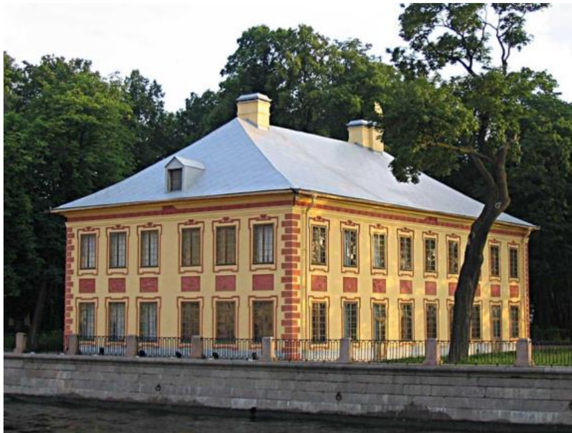
Летний дворец был построен по проекту Д. Трезини в 1710-1714 годах