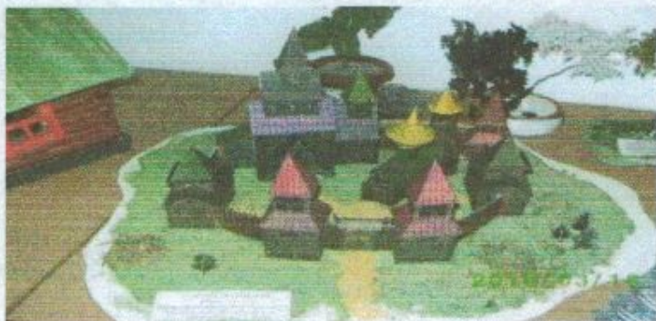
«Русская крепость». Коллективная работа 8-в класса