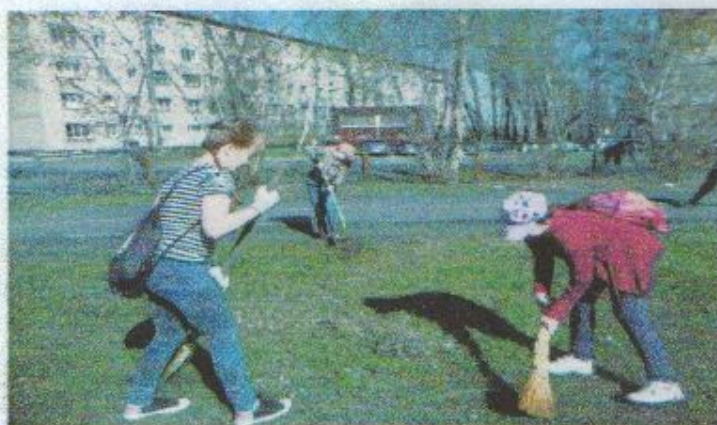
Чтобы было чисто