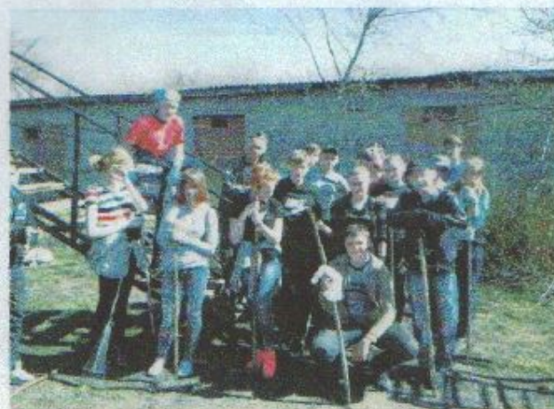
Мы даже не устали