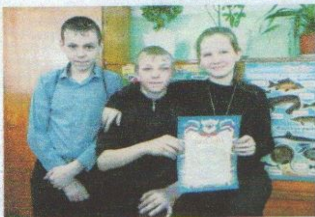
Самые умные биологи

Проведенная в школе Неделя биологии дала возможность повысить интерес учащихся к предмету, стимулировать их к поиску дополнительных материалов, расширить кругозор ребят.