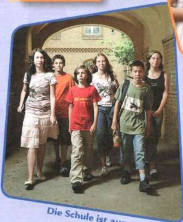
Die Schule ist aus.