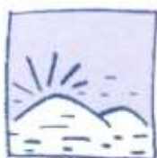
am Morgen morgens

Um halb neun. Um 16 Uhr./Um vier Uhr nachmittags. Um fünf. Montags, mittwochs und freitags. Am Montag, am Mittwoch und am Freitag.