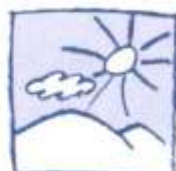
am Nachmittag nachmittags