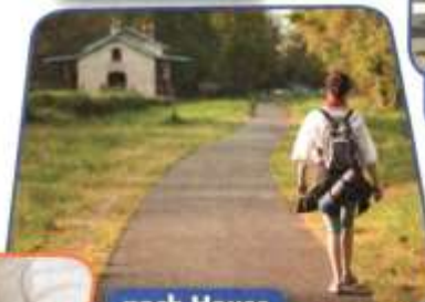
nach Hause gehen