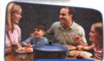
zu Abend essen