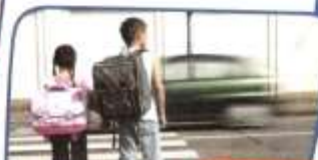
in die Schule gehen