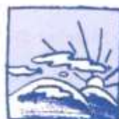
am Abend abends