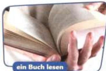
ein Buch lesen