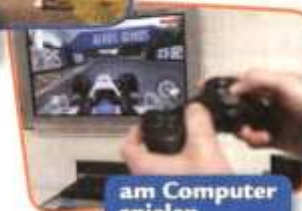
am Computer spielen