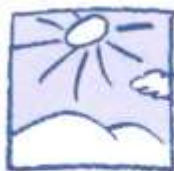
am Mittag mittags