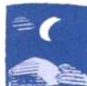
in der Nacht nachts