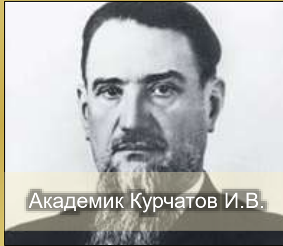
Академик Курчатов И.В.