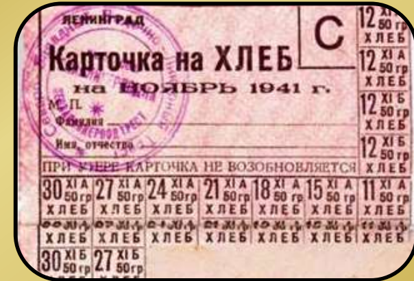
Отмена карточной системы (1947)