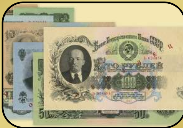
Денежная реформа (1947)