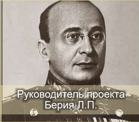
Руководитель проекта Берия Л.П.