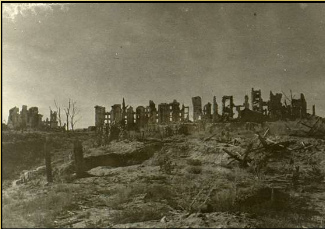
Разрушенный войной город

Урон , который был нанесен Советской экономике, огромен и ужасен. По официальным данным Советский Союз потерял около трети своего довоенного достояния: