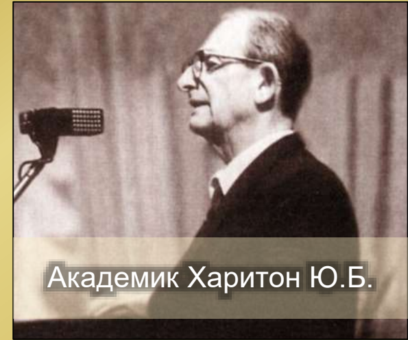
Академик Харитон Ю.Б.