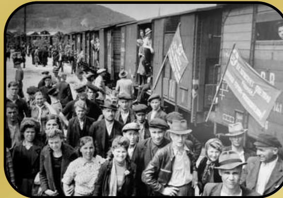
Репатриация советских граждан