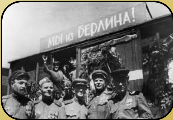
Демобилизация в армии и на флоте