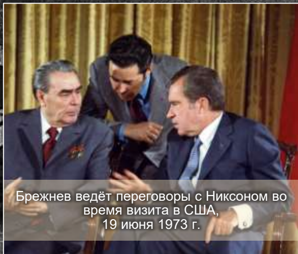
Брежнев ведёт переговоры с Никсоном во время визита в США, 19 июня 1973 г.