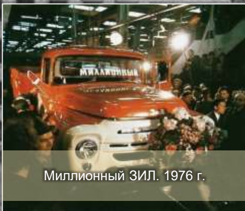
Миллионный ЗИЛ. 1976 г.