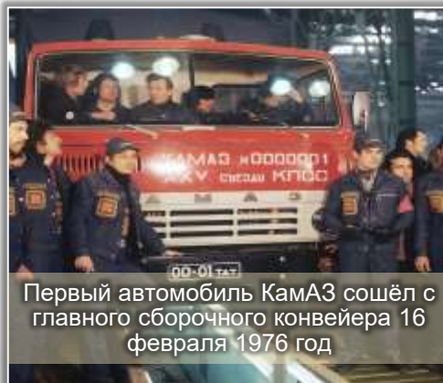
Первый автомобиль КамАЗ сошёл с главного сборочного конвейера 16 февраля 1976 год