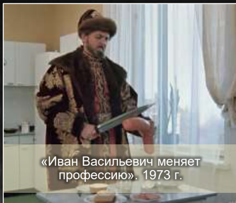
«Иван Васильевич меняет профессию». 1973 г.