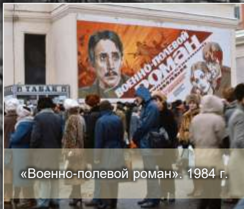
«Военно-полевой роман». 1984 г.