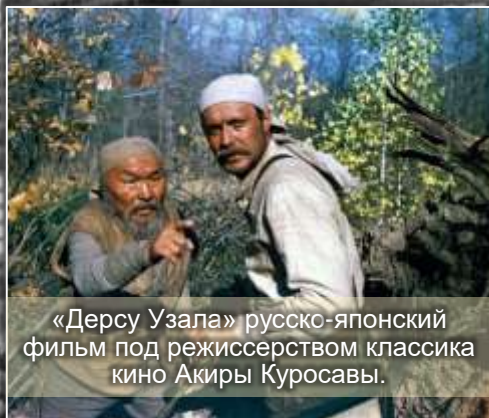
«Дерсу Узала» русско-японский фильм под режиссерством классика кино Акиры Кurosавы.