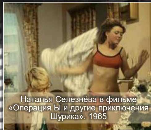
Наталья Селезнёва в фильме «Операция Ы и другие приключения Шурика». 1965