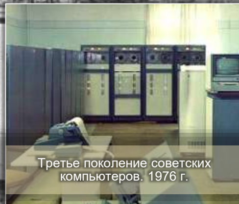
Третье поколение советских компьютеров. 1976 г.