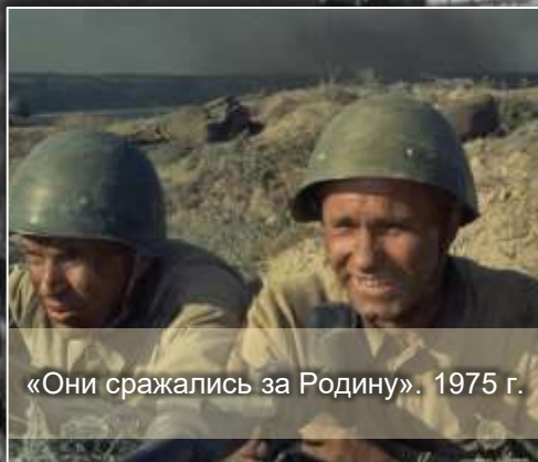
«Они сражались за Родину». 1975 г.