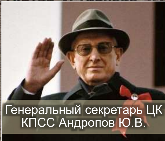
Генеральный секретарь ЦК КПСС Андропов Ю.В.