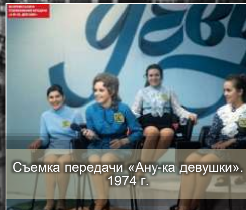
Съемка передачи «Ану-ка девушки». 1974 г.