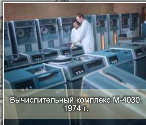
Вычислительный комплекс М-4030. 1974 г.