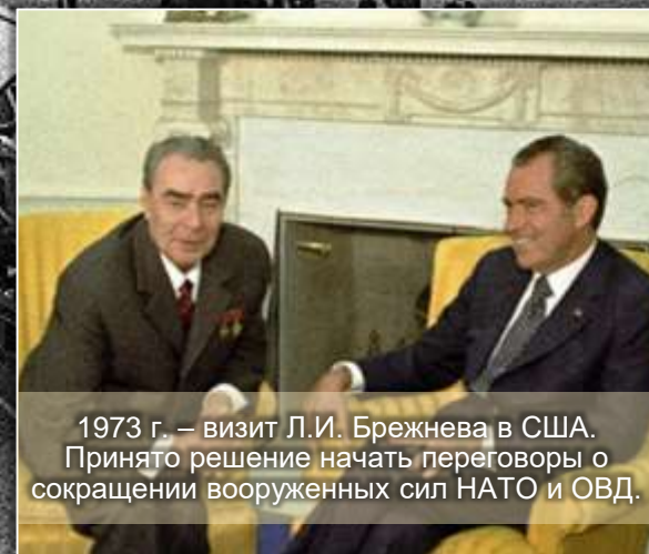
1973 г. – визит Л.И. Брежнева в США. Принято решение начать переговоры о сокращении вооруженных сил НАТО и ОВД.