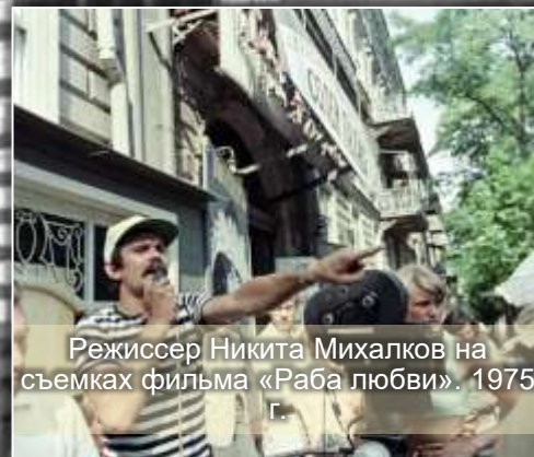
Режиссер Никита Михалков на съемках фильма «Раба любви». 1975 г.