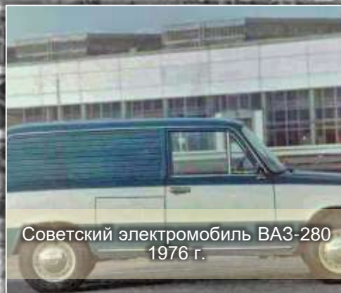
Советский электромобиль ВАЗ-280 1976 г.