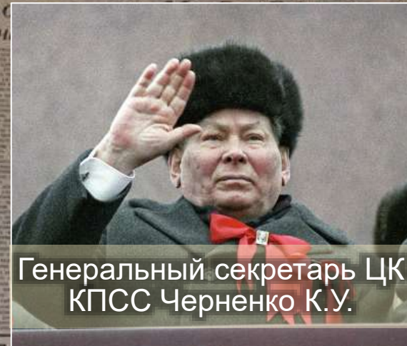
Генеральный секретарь ЦК КПСС Черненко К.У.

Серьезные кадровые перестановки: за 15 месяцев сменено 17 министров и 37 первых секретарей обкомов партии Введение мер по укреплению трудовой и государственной дисциплины