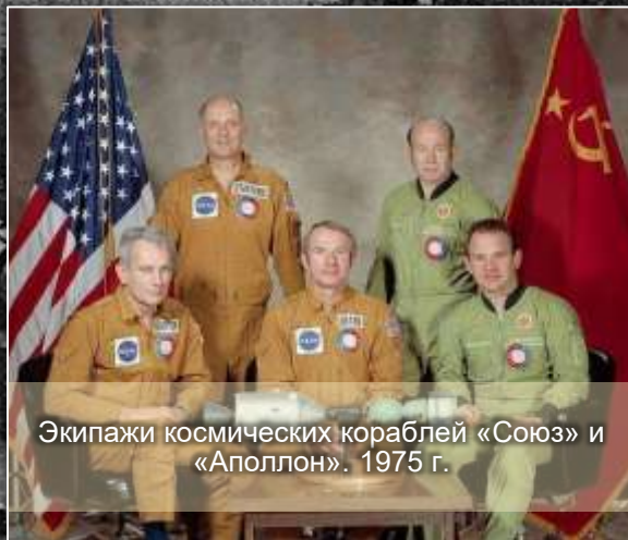
Экипажи космических кораблей «Союз» и «Аполлон». 1975 г.