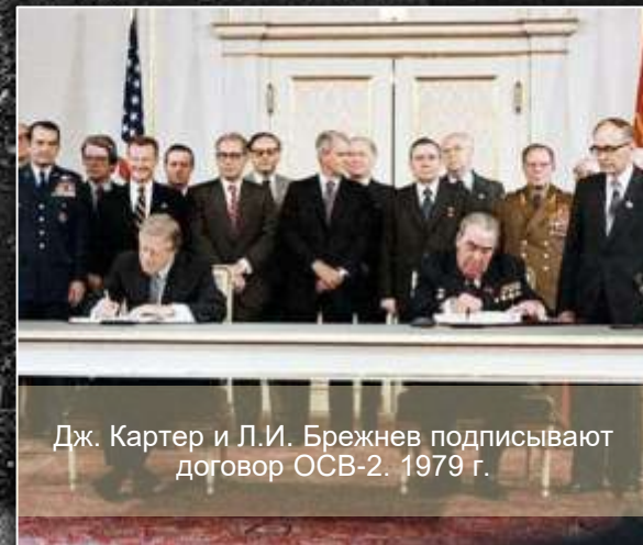
Дж. Картер и Л.И. Брежнев подписывают договор ОСВ-2. 1979 г.