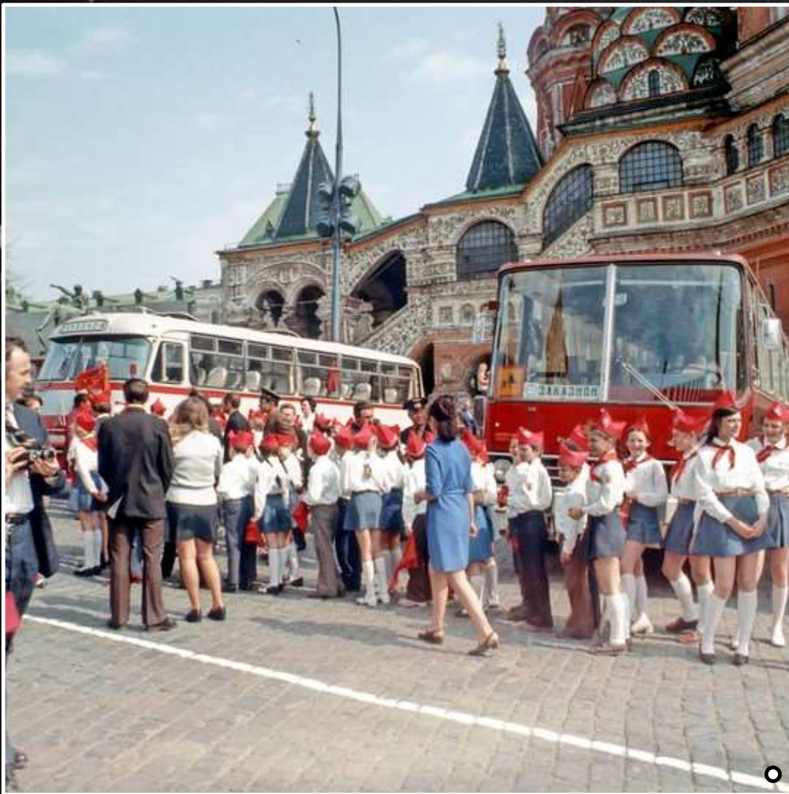
Школьная экскурсия, г. Москва