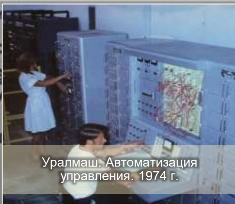
Уралмаш. Автоматизация управления. 1974 г.