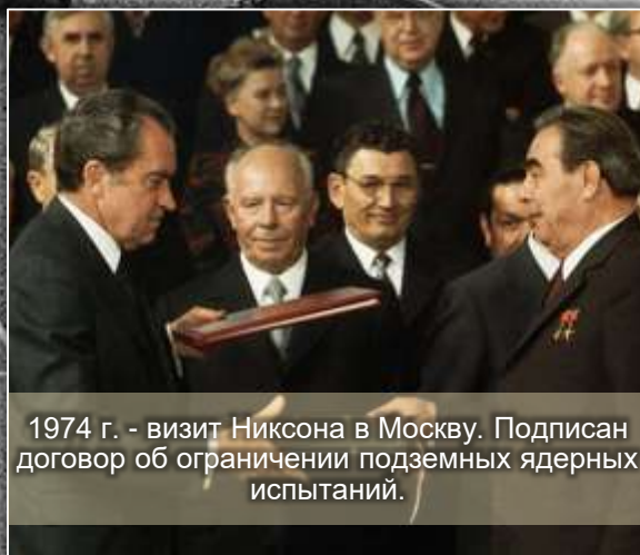
1974 г. - визит Никсона в Москву. Подписан договор об ограничении подземных ядерных испытаний.