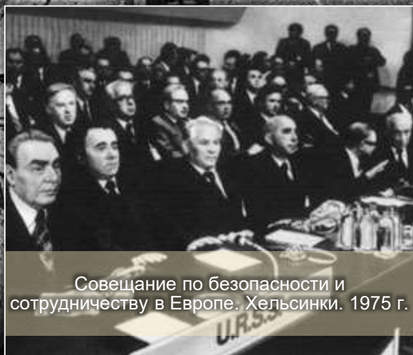
Совещание по безопасности и сотрудничеству в Европе. Хельсинки. 1975 г.