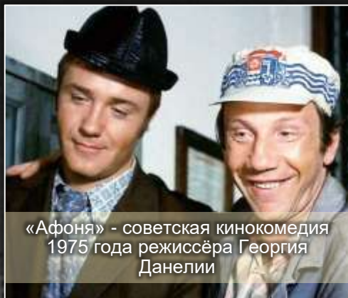
«Афоня» - советская кинокомедия 1975 года режиссёра Георгия Данелии