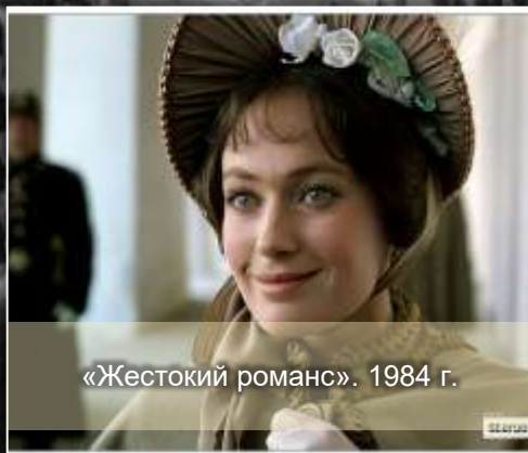
«Жестокий романс». 1984 г.