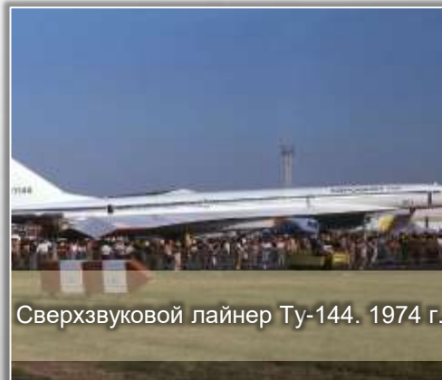
Сверхзвуковой лайнер Ту-144. 1974 г.