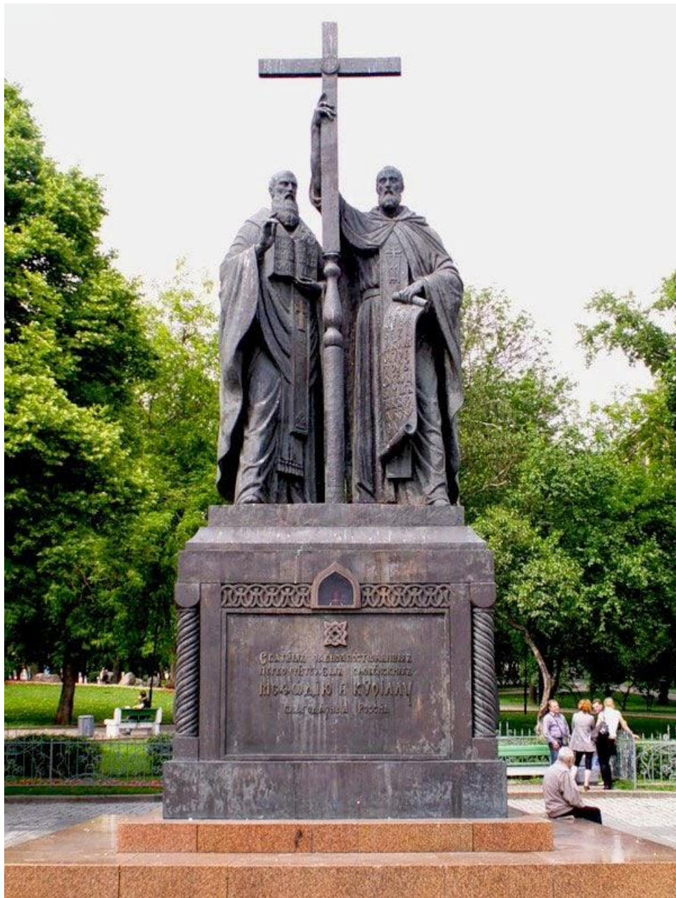
Памятник Кириллу и Мефодию в Москве