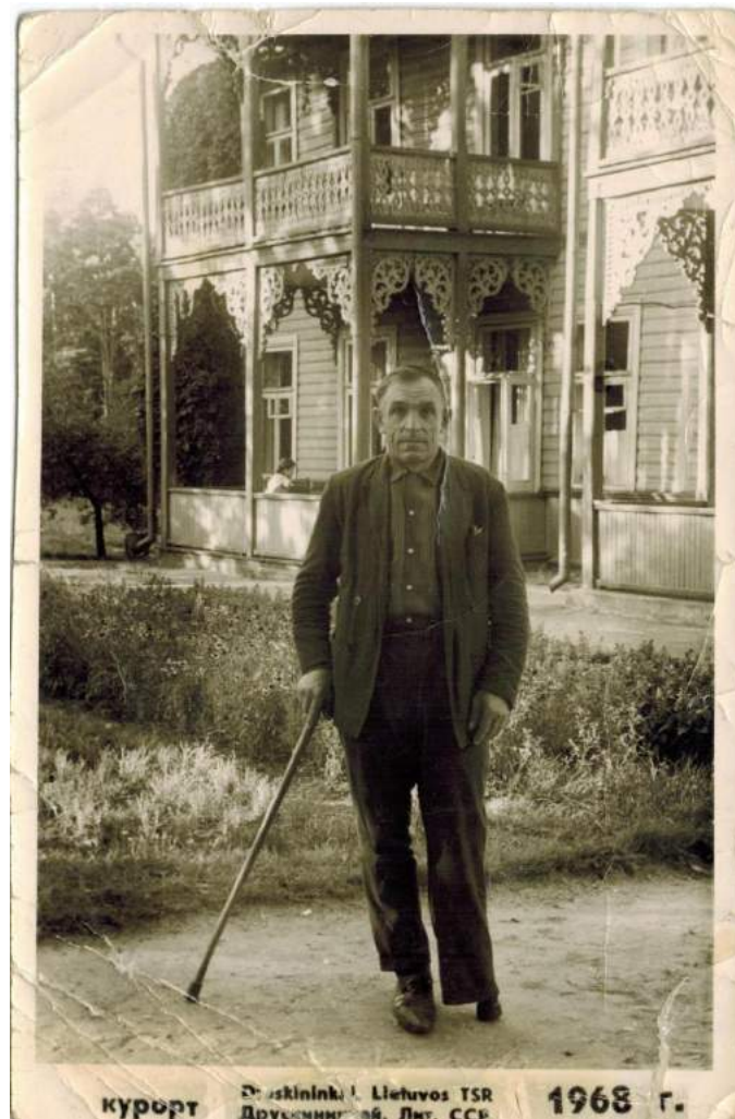
курорт Друскининкяй, Лит. ССР 1968 г.