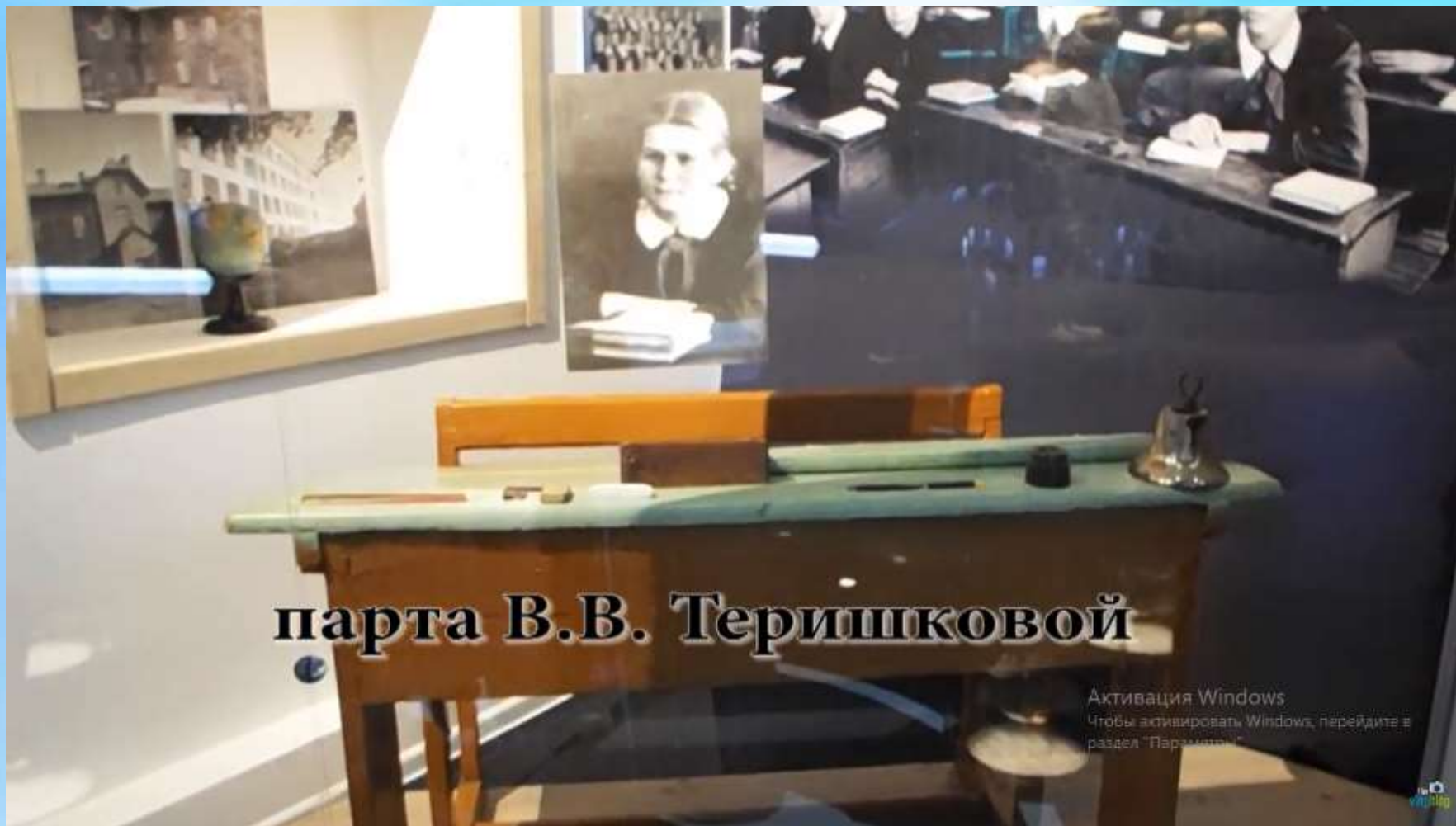
парта В.В. Теришковой

Активация Windows Чтобы активировать Windows, перейдите в раздел "Параметры."