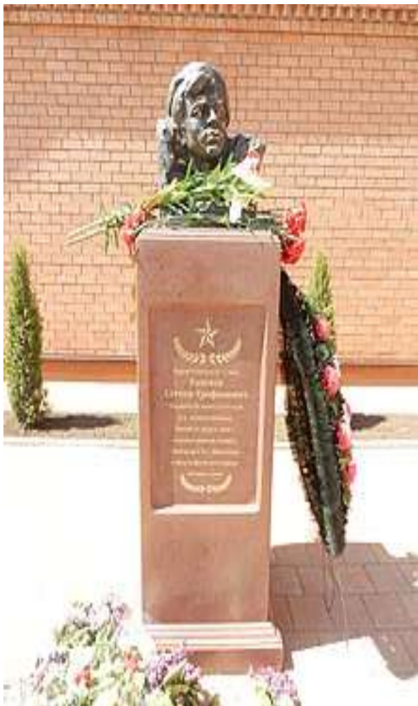
Памятник Степану Голеневу в г. Николаеве