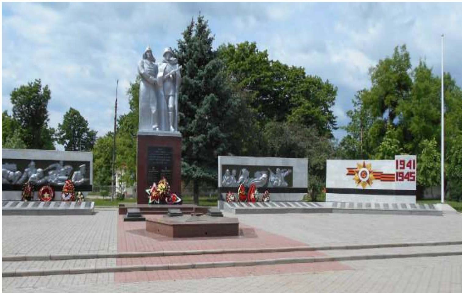
г. Белореченск. Обелиск в парке Победы