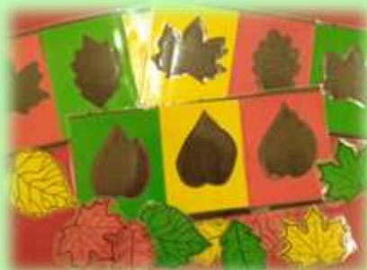
«Найди листочек», «Спрячь мышонка», «Собираем урожай»