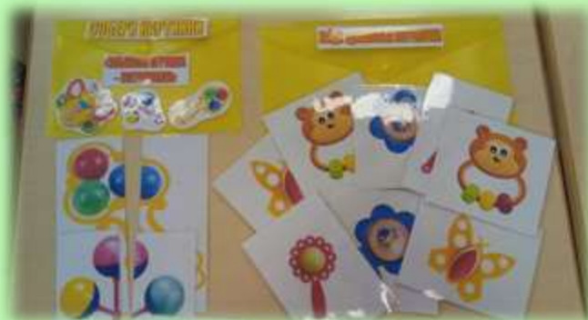
«Собери картинку», «Найди пару»