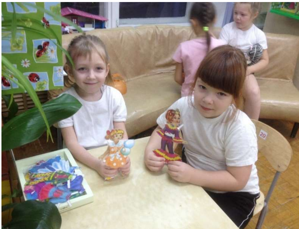
Игра с бумажными куклами в детском саду со своей подружкой.