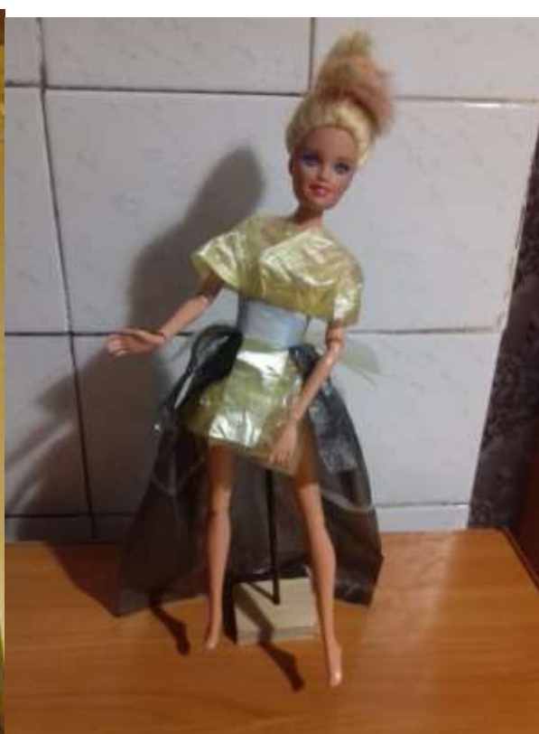
Это платье называется «Королева катка».