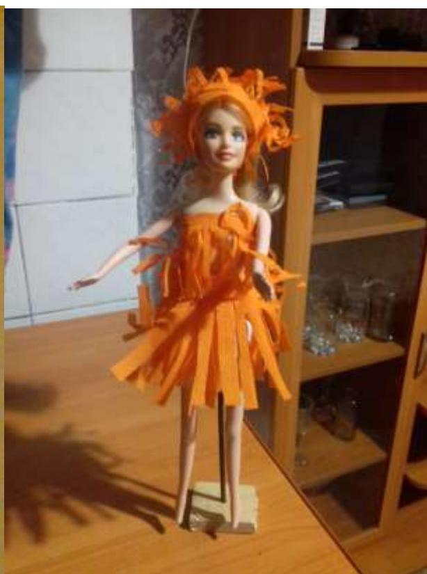
Это платье называется «Солнышко».