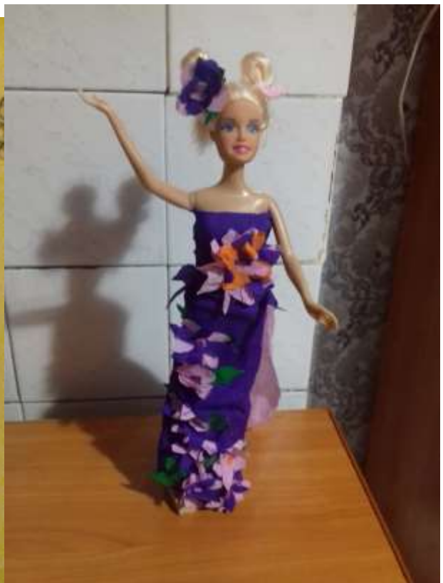
Это платье называется «Фея цветов».