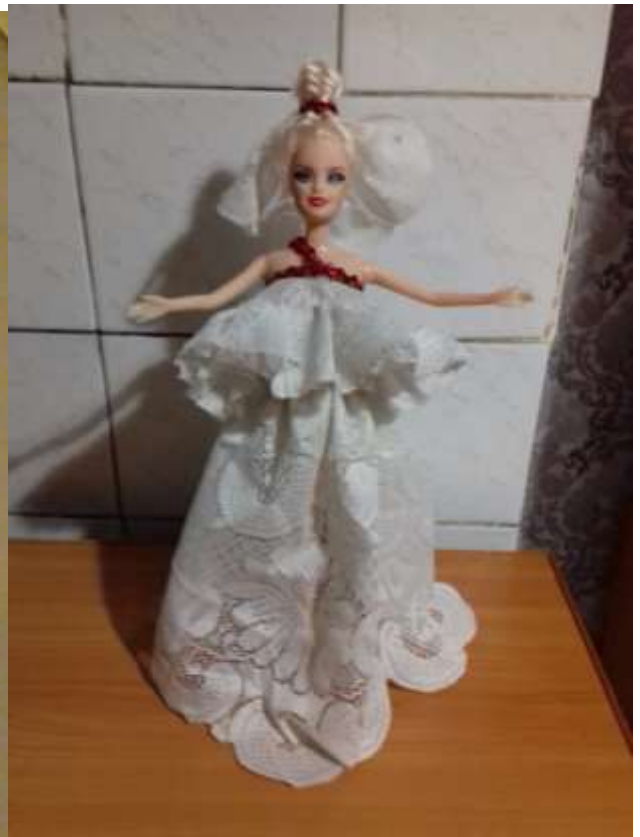
Это платье называется «Белый лебедь».