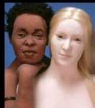
Деталь "Dual Nudes"