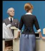
"Check out" диорама