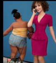
"Check out" диорама