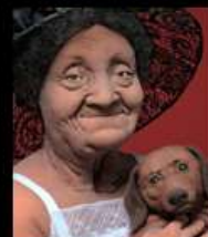
"Аркия и Астор"