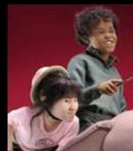
Деталь "Слон Поло"