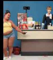
"Check out" диорама