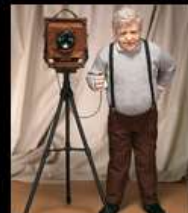
"Дон и его Дирдорф"