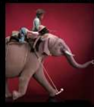
"Слон Поло" сторона