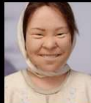
"Юконская девушка" деталь