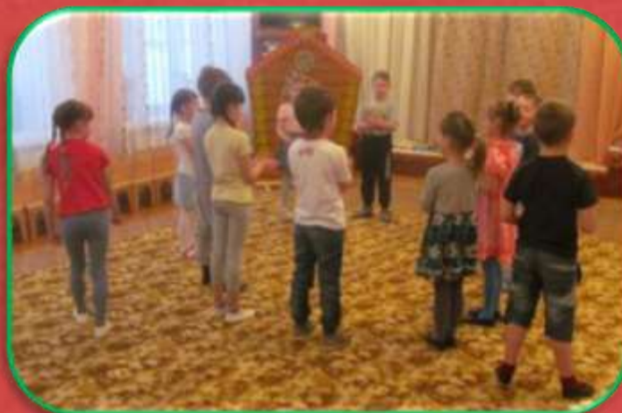
«Гори, гори ясно!»