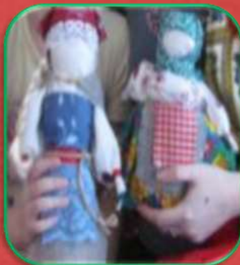
«Мотанка», «Берегиня» кукла-оберег