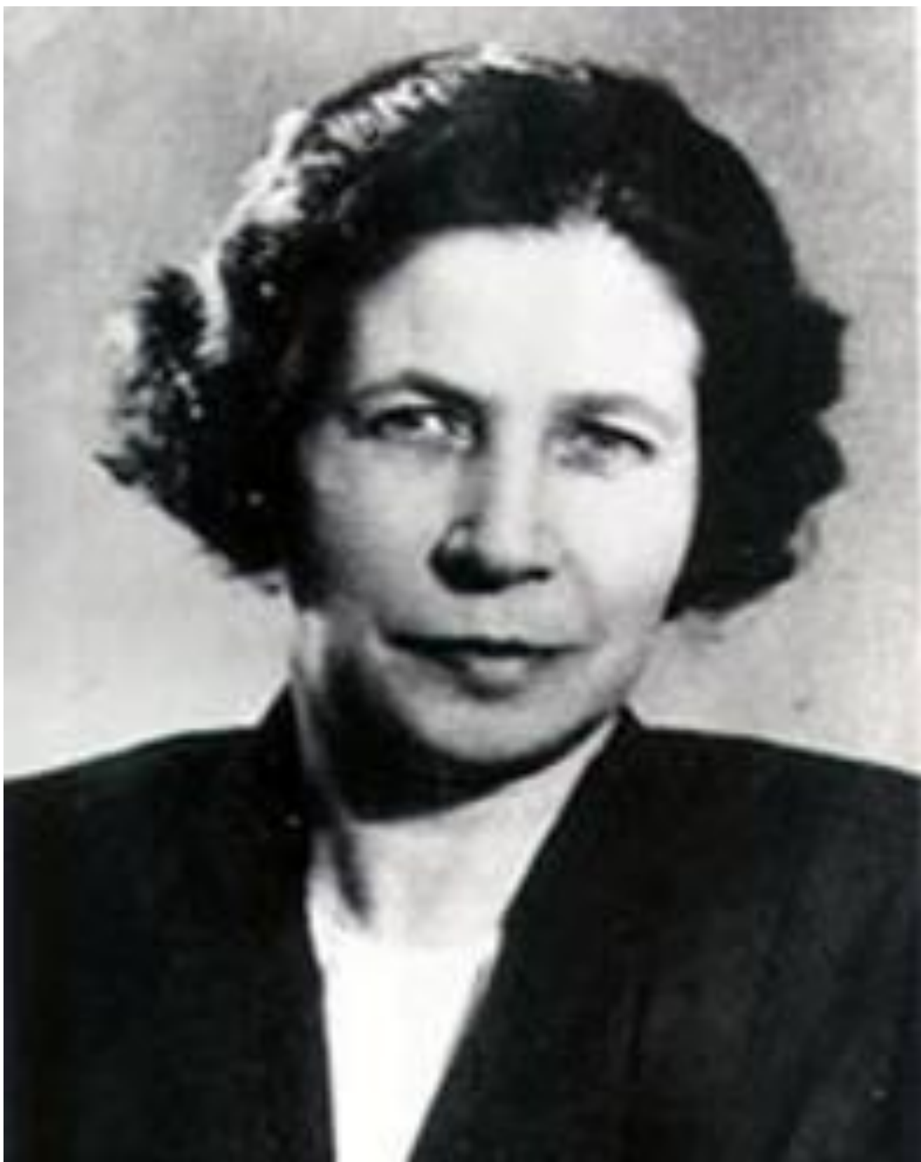
Ханс Кристиан Андерсен