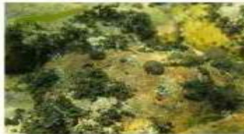
Водные лишайники и носток

Водоросли – это растения, у них нет корней, стеблей, ни листьев. Есть совсем крохотные, есть большие, зеленые, синезеленые, золотистые.