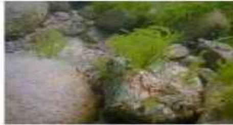
Драпарнальдиоидес, каменистый грунт