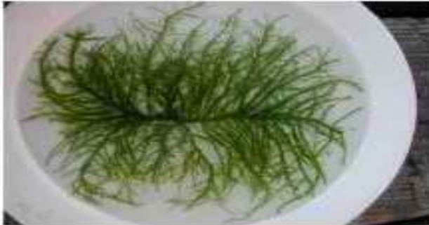
Драпарнальдиоидес, внешний вид