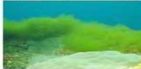
Подводный ландшафт – драпарнальдиоидес, тетраспора