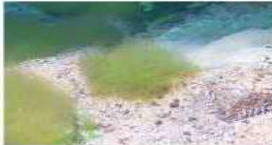
Драпарнальдиоидес, песчаный грунт