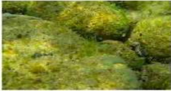
Подводный ландшафт – тетраспора, носток