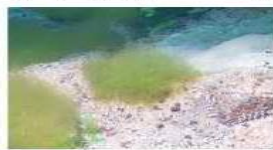
Драпарнальдиоидес, песчаный грунт