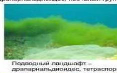
Подводный ландшафт – драпарнальдиоидес, тетраспора