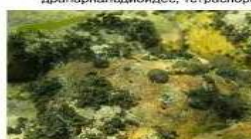
Водные лишайники и носток

Водоросли – это растения, у них нет корней, стеблей, ни листьев. Есть совсем крохотные, есть большие, зеленые, синезеленые, золотистые.