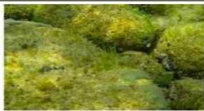
Подводный ландшафт – тетраспора, носток.