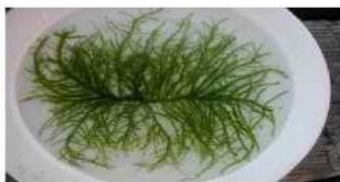
Драпарнальдиоидес, внешний вид