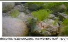
Драпарнальдиоидес, каменный грунт