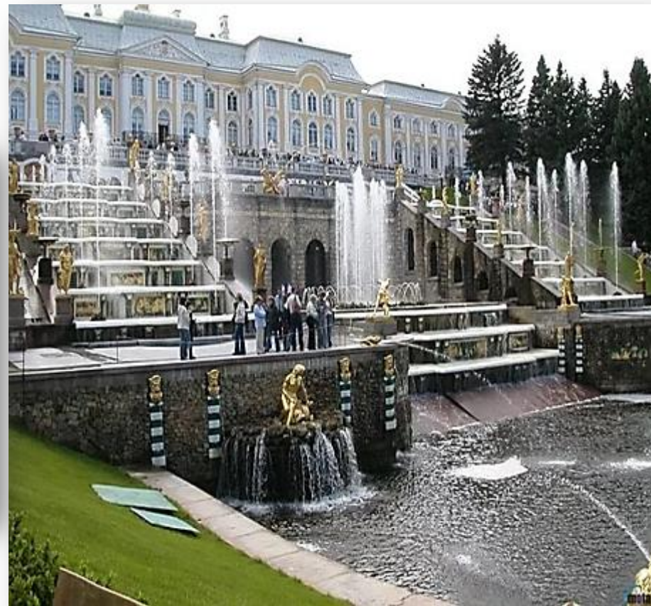
Петергоф Дворцово-парковый ансамбль