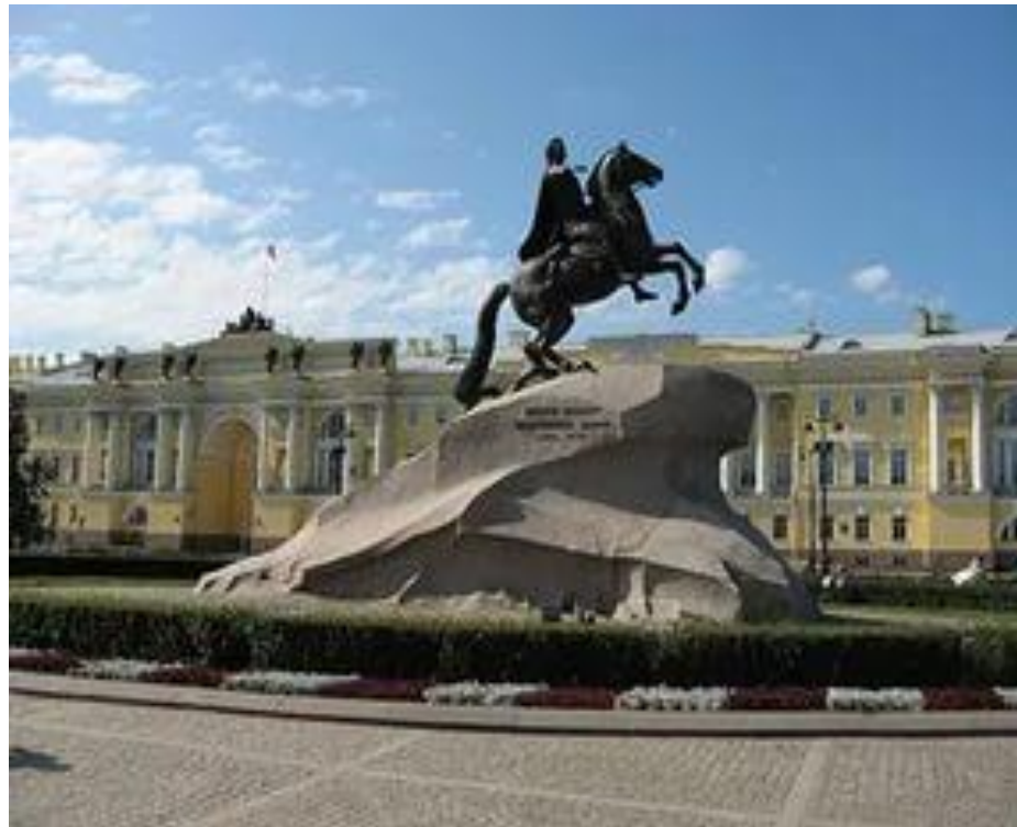
«Медный всадник» Памятник Петру I на Сенатской площади