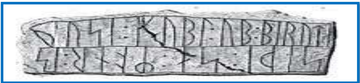
Сторона В рунического камня из Дании. Надпись читается как busi : kubl : ub : biruti , что переводится как «Чародеем будет тот человек, который разрушит этот памятник»

Надпись гласит: Tilarids , что значит «целеустремлённый»