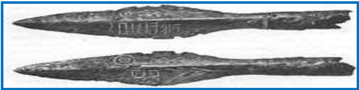
Надпись на копье из Ковеля (Западная Украина). Образец ранней рунической надписи (IV в.), написанной бустрофедоном.

Надпись гласит: Tilarids , что значит «целеустремлённый»