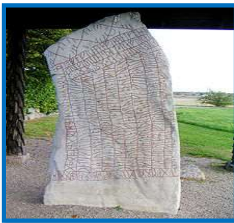
Руническая надпись на камне из Рёка, восточная сторона Руническая надпись на камне из Рёка, западная сторона