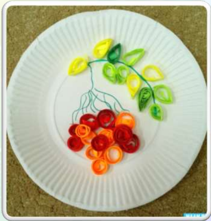
Подарок для любимой мамочки