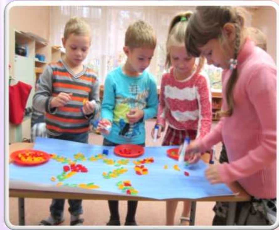
Коллективная работа на любую тему