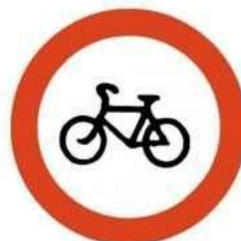
Движение на велосипедах запрещено