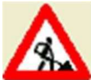
• Дорожные работы