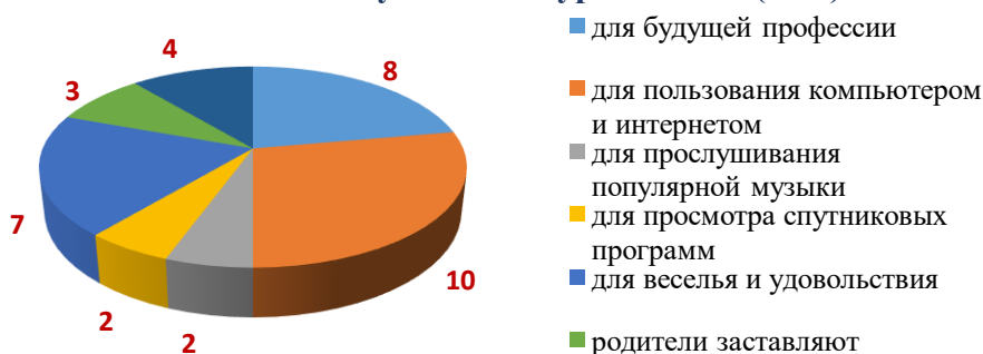
Роль английского языка в жизни студентов 2 курса ББМК (чел.)

Полученные данные показывают, что на 2 курсе изучение иностранного языка носит частично практический характер. Как и студенты 1 курса, студенты 2 курса изучают английский язык, чтобы активно пользоваться Интернетом. Вместе с тем, часть студентов связывают знание английского языка с будущей профессией, так как Россия интегрируется в мировое сообщество, поэтому процесс овладения английским языком для налаживания контактов становится все более актуальным. Однако настораживает тот факт, что некоторые студенты затрудняются определить роль английского языка в своей жизни. Это может быть связано как с отсутствием устойчивой мотивации к изучению языка, так и с тем, что они имеют невысокий уровень знаний по дисциплине.