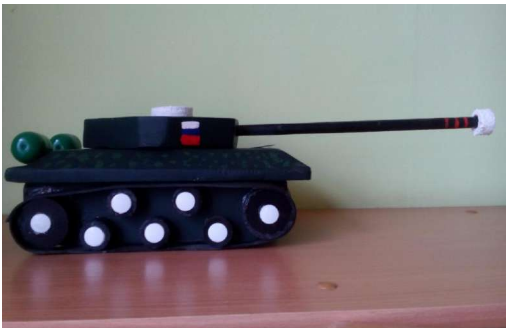
Поделки к 23 февраля.