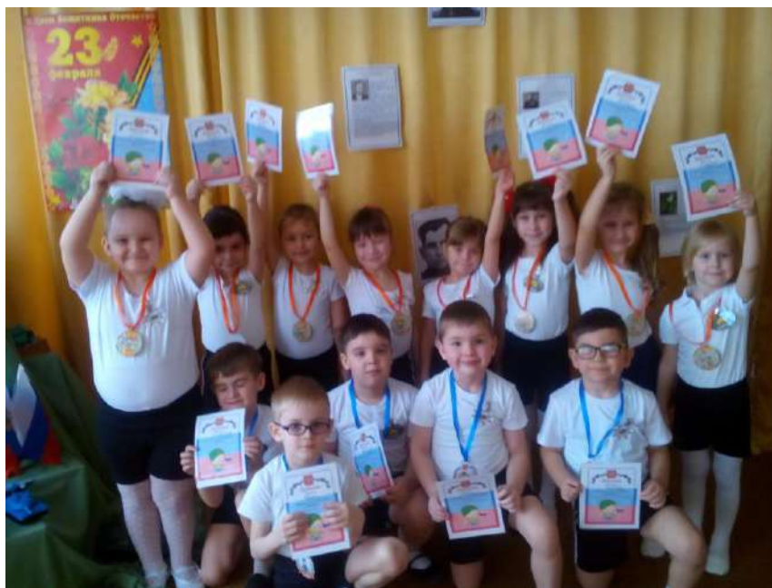
Поздравление ветерана с Днем Победы.