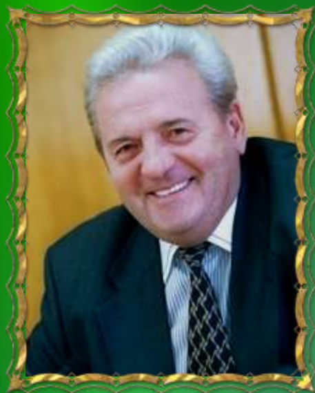
Спиридонов Юрий Алексеевич (01.11.1938-12.08.2010)

Первый секретарь Коми областного комитета КПСС в 1989-1990 гг., Председатель Верховного Совета РК в 1990-1994 гг., Глава Республики Коми с 1992-2002 гг., с 2003-2007 гг. Депутат Государственной Думы РФ четвертого созыва.