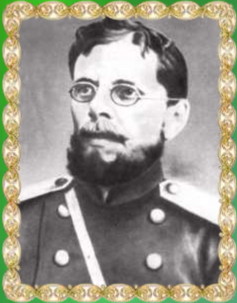
Иван Алексеевич Куратов - коми поэт, переводчик, лингвист, философ (06.07.1839-17.11.1875)