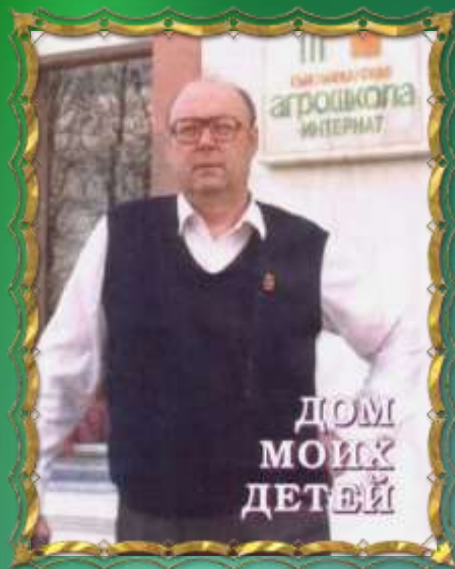
Католиков Александр Александрович (13.10.1941-12.06.1996)

Первый секретарь Коми областного комитета КПСС в 1989-1990 гг., Председатель Верховного Совета РК в 1990-1994 гг., Глава Республики Коми с 1992-2002 гг., с 2003-2007 гг. Депутат Государственной Думы РФ четвертого созыва.