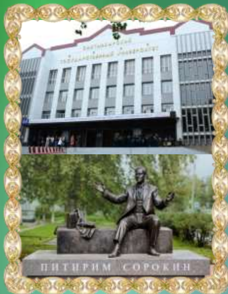
Питирим Александрович Сорокин – коми этнограф и просветитель, российско-американский социолог, почетный профессор Гарвардского университета (23.01.1889-10.02.1968)

Родился в с. Турья Архангельской губернии, (ныне Княжпогостский район РК) в семье мастера по украшению икон. До 15 лет жил и воспитывался в Коми. Учился на социолога в Петербургском психоневрологическом институте, затем перешел на юридический факультет Петербургского университета. Много внимания уделял изучению Коми края, его древней истории, языческим верованиям, отмечал высокую нравственность народа «зыряне – народ мирный, гостеприимный и честный...», необходимость подъема образования и культуры земляков. В 1922 г. эмигрировал из России в США.