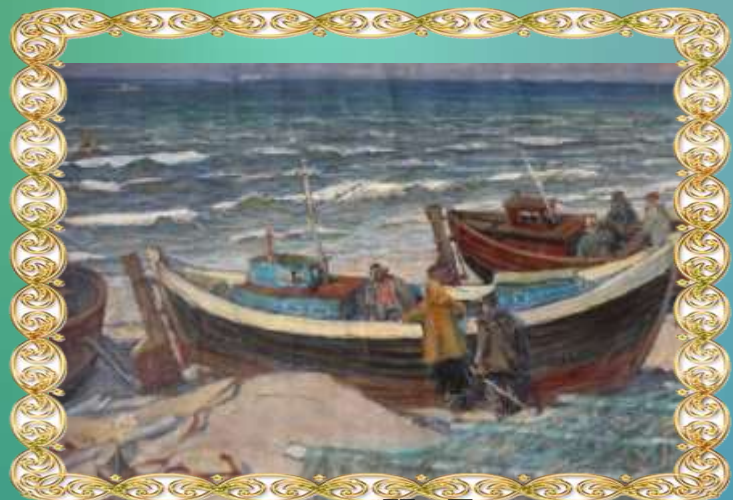
«На Балтии весна»