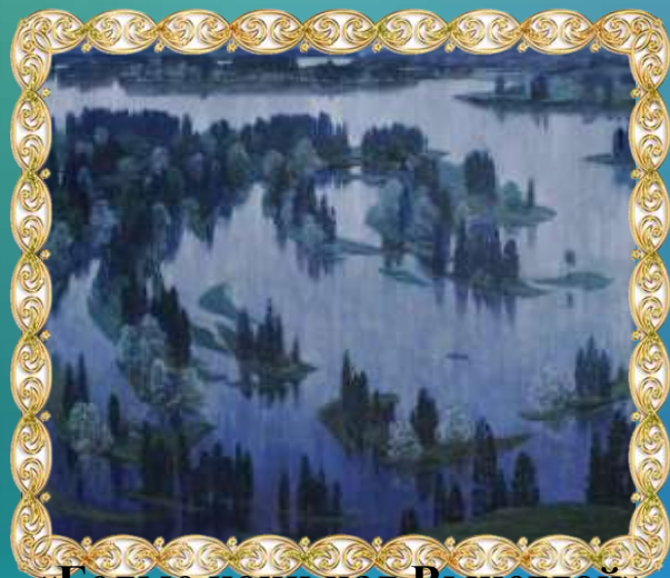
«Белые ночи над Вычегдой»