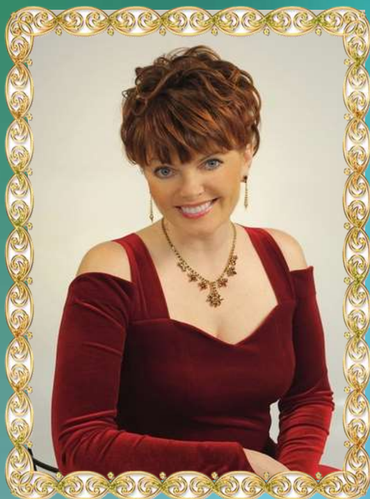
Ольга Александровна Сосновская

Заслуженная артистка России. Народная артистка Республики Коми, лауреат международного и всероссийского конкурсов вокалистов. Солистка государственного театра оперы и балета РК. Почетный гражданин г. Сыктывкара.